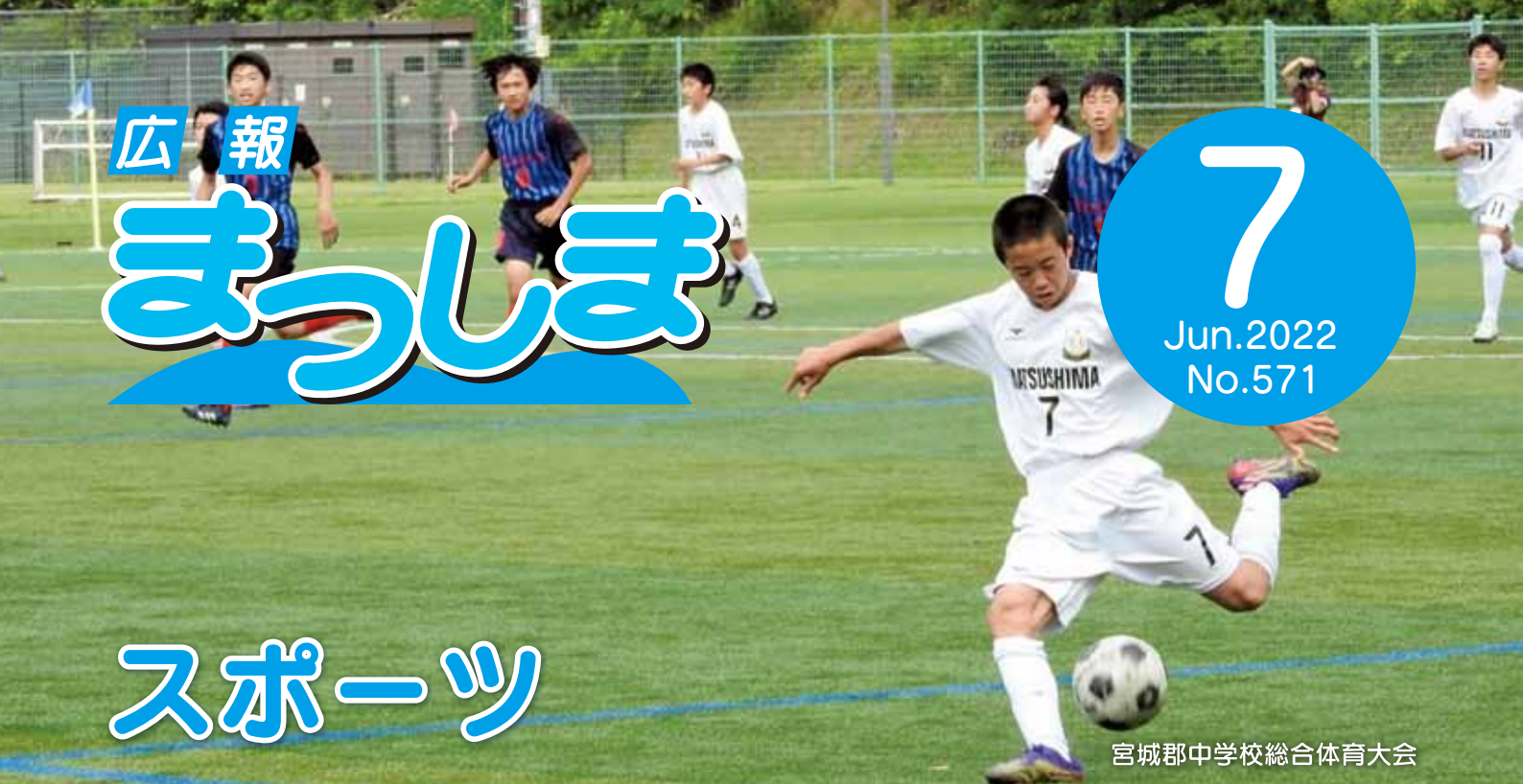
宮城郡中学校総合体育大会