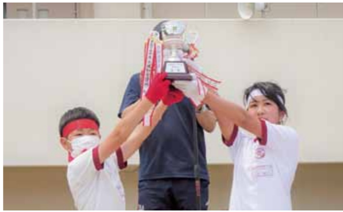
▲接戦の結果、赤組白組同点優勝！（第一小学校）