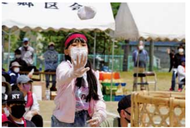
▲一球一球に歓声が上がった玉入れ