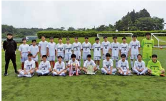
▲見事優勝を決めた松島中学校サッカー部