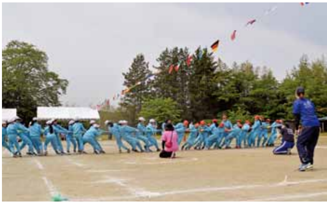
▲力いっぱい引き合い頑張りました（第五小学校）