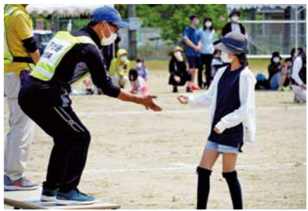
▲白熱した分館長とのジャンケン対決