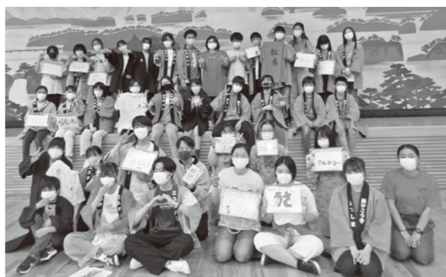
▲市町の垣根を越えて楽しく交流できました