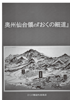
▲奥州仙台領の「おくの細道」

5月29日に、三町ジュニア・リーダー合同研修会を文化観光交流館で実施しました。塩竈市、多賀城市、七ヶ浜町、利府町からジュニア・リーダーが集まり、スタンツやダンスの研修をおして交流を図りました。松島町のジュニア・リーダーはホスト役として会場設営や会の運営にも積極的に取り組み、学びの多い一日となりました。