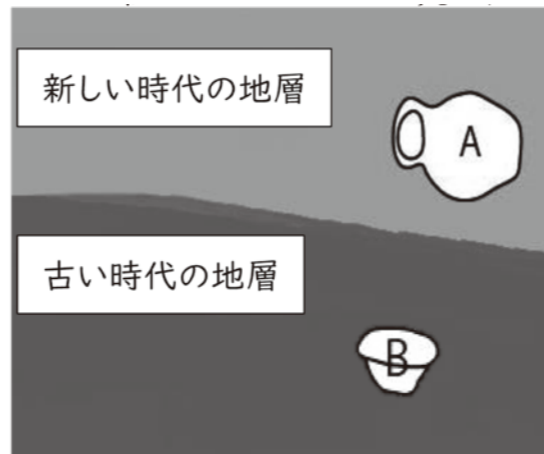
地層のイメージ：古 B→A 新