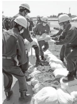
積み土のう工法を実施する松島町消防団