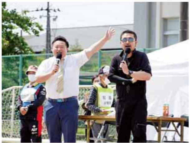
▲ストロングスタイルの実況中継で会場は大盛り上がり！

今年度は、優勝・根廻分館、準優勝・上竹谷分館、3位・下竹谷分館という結果となりました。