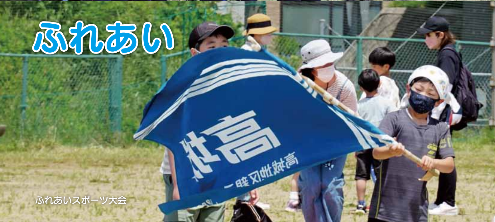
ふれあいスポーツ大会