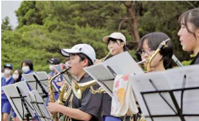
▲吹奏楽部による熱い演奏で選手たちにエールが送られました