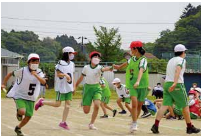
▲懸命にバトンをつなぎました（第二小学校）

当日は天候に恵まれ、新型コロナウイルス感染症対策に加え、熱中症対策を行いながらの運動会となりました。