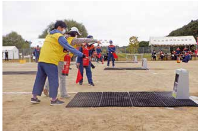
▲本郷地区婦人防火クラブが出場した消火器の部のようす