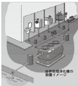
合併処理浄化槽の設置イメージ