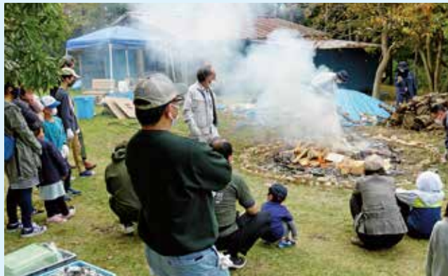
大きなたき火で土器を焼く様子をみんなで見守ります

松島町手樽地域交流センターと塩竈市公民館に分かれて粘土から土器の形を作り、約2ヶ月乾燥させた後、七ヶ浜町の大木田貝塚公園で野焼きをしました。