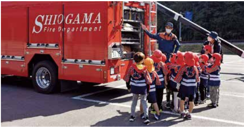
▲車両の装備や仕組みの説明を受ける園児たち