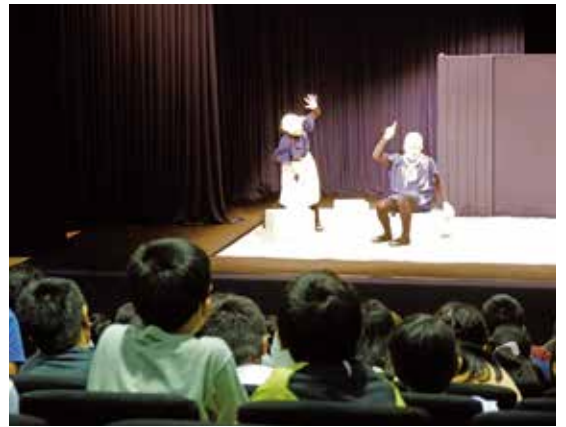
▲おもしろい場面の数々に身を乗り出して鑑賞していました