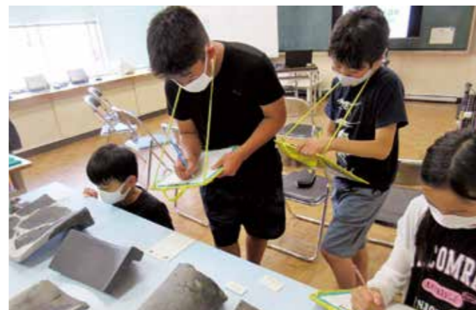
▲瑞巖寺の瓦をスケッチしてみよう！

7月30日にアトレ・るハー(文化交流館)で夏祭り盆踊り「みんなで踊れるようになろう」講習会が行われました。 町芸術文化協会の協力のもと伝統芸能である大漁唄い込みをはじめとする盆踊りを約70人の方で練習しました。 新型コロナウイルスの影響により2年間地区の夏祭りが実施されていない中、参加されたみなさんは久しぶりの盆踊りに、振り付けを思い出しながら一生懸命に踊りました。