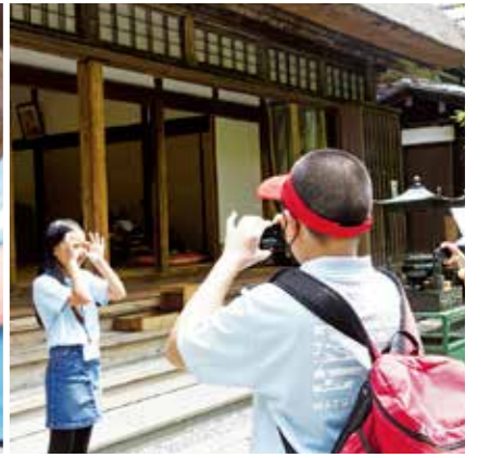
▲ジェスチャーでの表現やカメラマンに挑戦しました