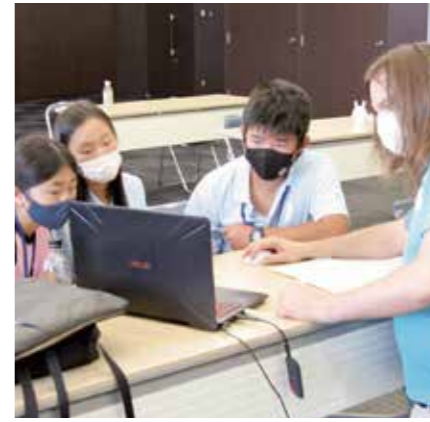
▲動画の編集作業に奮闘中