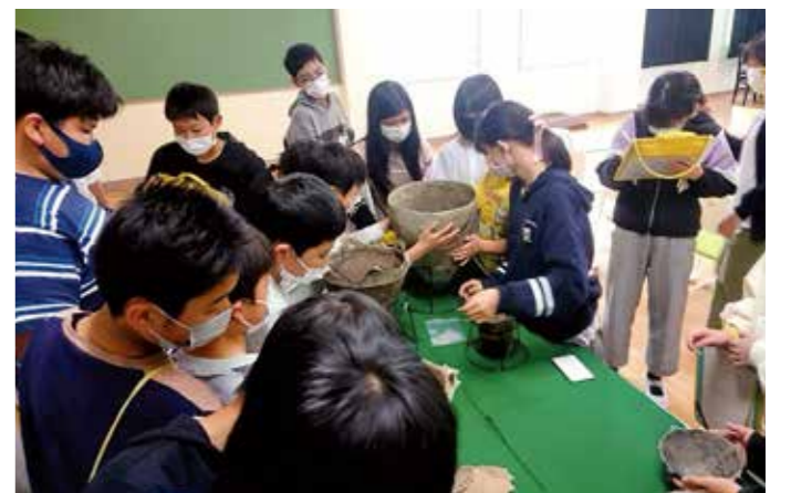
▲縄文土器はどんな手ざわり？