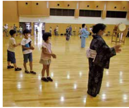
▲芸術文化協会のみなさんの指導のもと、盆踊りの輪ができました！

ジュニア・リーダー奮闘中! 新型コロナウイルスの影響で、ここ数年ジュニア・リーダーの活躍の場もめっきり減少していましたが、今年の夏は多くの派遣依頼をいただきました！ しおかせ食堂主催「ふれあいキャンパス」・初原分館事業・松五小子ども会「三松まつ祭り」・海の盆に参加し、鬼ごっこやゲームなどのレクリエーションを通じて各会場に集まったたくさんの子ともたちと一緒に楽しい時間を過ごすことができました。 参加した会員のほとんどは派遣事業に初挑戦でしたが、事前に打合せやルール説明の練習をした上で臨み、奮闘する姿が見られました。 ●ジュニア・リーダーの活動や行事への派遣に関する問合せ 教育課生涯学習班 ☎354・5714