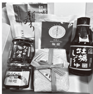
松島の地場産品詰め合わせ