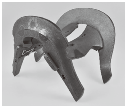
金梨地九曜紋竹雀文時絵鞍