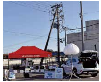
▲実際に自動車からの電気で家電を動かす様子