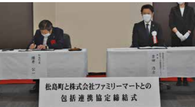
▲協定書に署名をする様子

令和4年11月28日、松島町役場にて宮城三菱自動車販売株式会社と災害時における電動車両及び給電装置の貸与に関する協定を締結しました。 災害発生時に宮城三菱自動車販売株式会社より電動供給機能を備えた電動車両の貸与が可能となり、電動車両からは一般家庭の約10、12日間の給電ができます。今回の協定により災害発生時のライフラインの確保が期待されます。