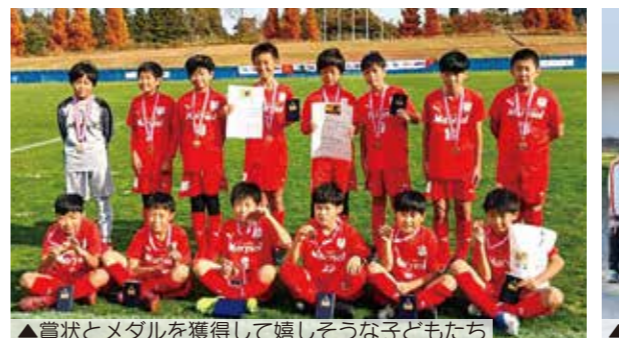
▲賞状とメダルを獲得して嬉しそうなお子どもたち

令和4年12月3日、町内各幼稚園と高城保育園分園で生活発表会が行われました。年少、年中組は「エビカニクス」や「パンぱんだ」をみんなで楽しく踊りました。年長組は「金のがちよう」などの劇や「ジングルベル」の合奏や歌を元気に披露しました。年少組は初めての発表会で緊張しながらもみんなで仲良く頑張りました。年中組は昨年よりも上手に表現しようとして一生懸命発表していました。年長組は、自信いっぱい元気よく発表していて、幼稚園生活の集大成を見せてくれました。子どもたちからは「ときどきしたけど頑張った」「楽しかった」などの感想が聞かれました。