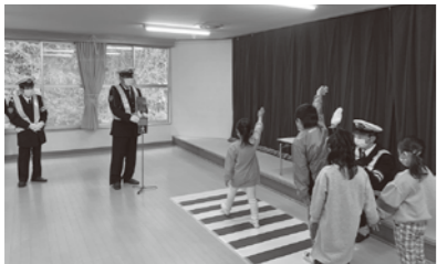
▲松島第一幼稚園交通安全教室のようす