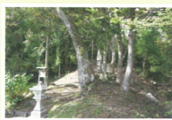
湯ノ原温泉 霊泉亭