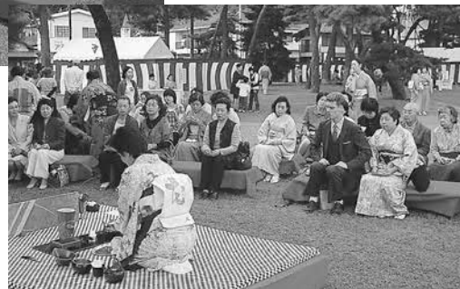
▲外国人の方も緊張しながら日本の伝統文化を体験