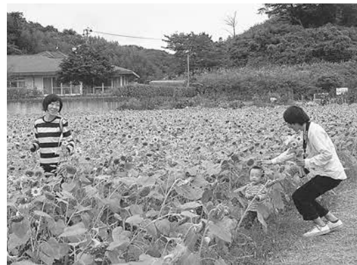
▲多くの家族連れなどが摘み取りや散策を楽しんでいました