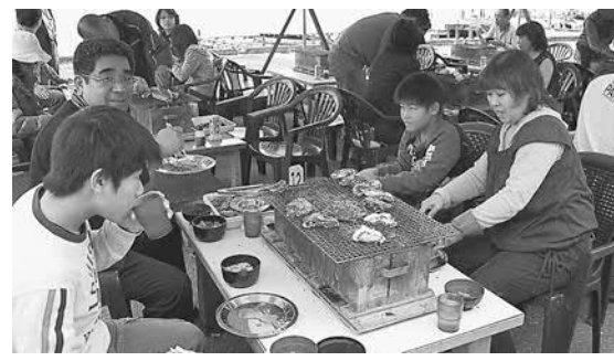
▲ゆっくりかきが味わえるかきの里