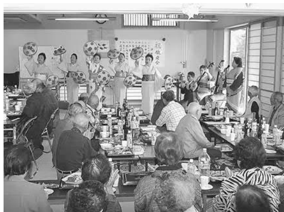
▲花笠踊りが披露され和やかな雰囲気になりました