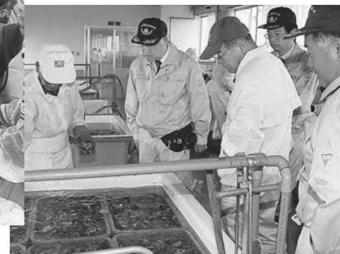
▲大橋町長が猛暑の影響で心配されたかきの状況を確認