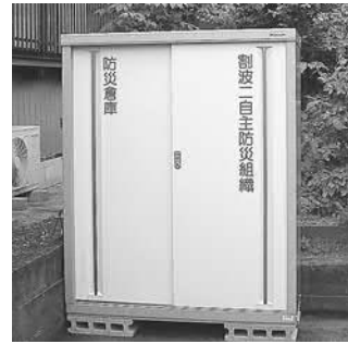
▲貸与された貸機材格納庫

また、町より格納庫の貸与がありハンドマイクや水タンク、サーチライト等の資機材を格納し災害時に備えています。