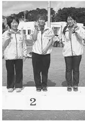
▲松島地区婦人防火クラブの皆さん