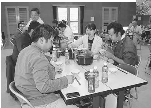
▲生産者と宿泊施設の関係者が一緒に新米を味わいました