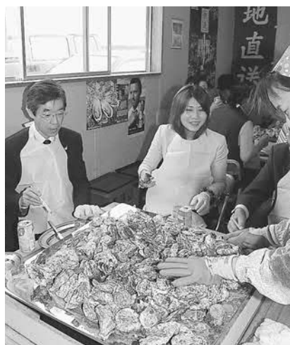
▲豪快に運ばれてきたかきに笑みがこぼれます

今年は猛暑だったため一時は生育が心配されましたが、高温で成長が遅れていたものの、日を追う毎に実入りが良くなり、味は例年通りの美味しさだそうです。