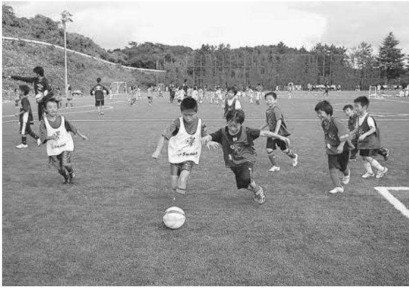
▲広い人工芝のグラウンドでスポーツの秋を満喫

また、天皇杯で活躍したソニー仙台FCの選手によるサッカー教室も開催され、子どもたちはドリブルでの鬼ごっこや選手も参加してのゲームなどを楽しみながら、スポーツの秋を満喫しました。