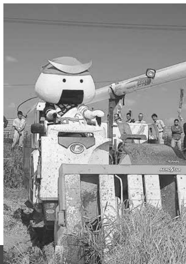
▲むすび丸もコンバインで稲刈りに挑戦