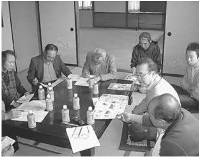
▲自主防災の大切さを学んだ防災勉強会

四月十八日には初の自主防災組織における災害勉強会を開催し、災害時、避難所における活動方法や地区における自助共助の大切さを学びました。