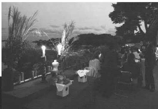
▲祭壇に飾られたススキやろうそくが幻想的な雰囲気を演出