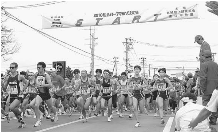
▲過去最高の6,035人のランナーが秋晴れの松島路を快走しました