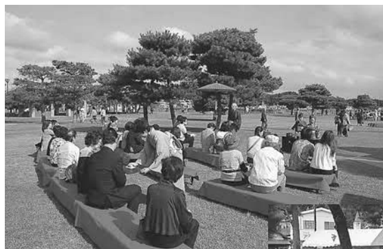
▲日本三景の風景を背景に各流派が縁席を設けお手前を披露

当日は爽やかな風が吹く秋晴れとなり、各流派の縁席では、お茶と季節のお菓子を味わいながら、日本の伝統文化に触れるひとときを味わう人々でにぎわいをみせていました。