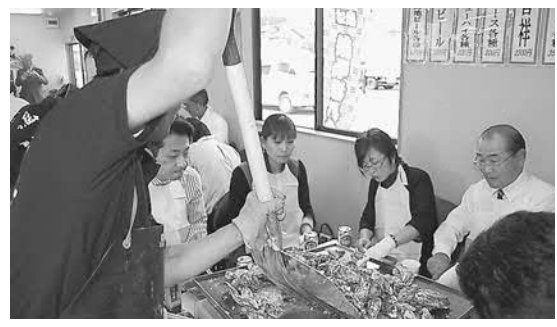
▲町内で3軒目の殻付かきが味わえる店「焼がきハウス」がオープン（松島さかな市場敷地内）