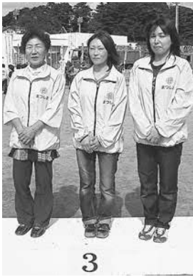
▲上竹谷地区婦人防火クラブの皆さん