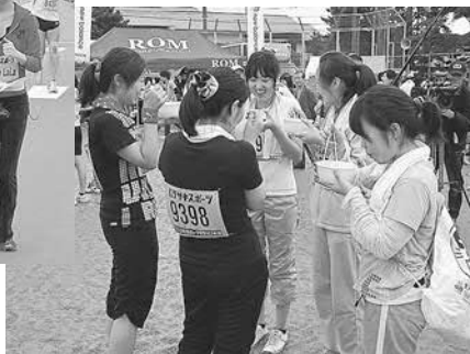
▲大会名物の松島かき汁で疲れた体も癒されます