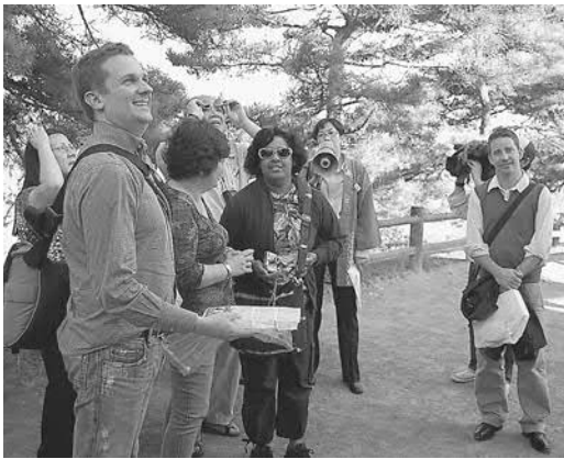
▲五大堂を見学する APEC 高級実務者の方々

参加者は「海と島と寺の景色が素晴らしい!」「ぜひまた訪れたい」と賞讃。松島の魅力を満喫したようでした。