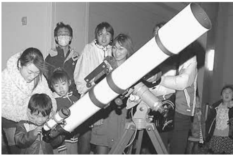
▲天体望遠鏡で夜空を見る参加者