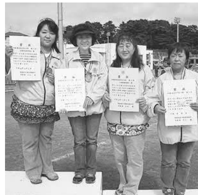
▲左から桜渡戸地区、幡谷地区 婦人防火クラブの皆さん