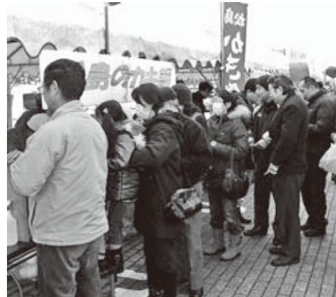
▲大好評だった松島のかき鍋

松島のカキ鍋を食べたお客さんは「やっぱり松島のカキは違うね。今度は松島に行ってカキを食べたいね」と松島のカキのおいしさに感動している人もいました。