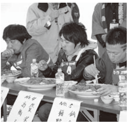
▶約一・五キロのかき丼に参加者もつらい表情

んは、「松島のかきのおいしさは、寒さに勝るおいしさですね」と話し、炬端を囲んで旬のかきを味わっていました。