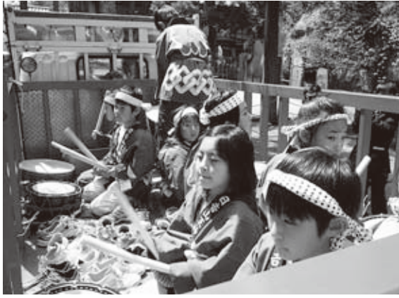
▲地域の文化などを知ることは、地域を支える人材の育成につながります（日吉山王神社お囃子）