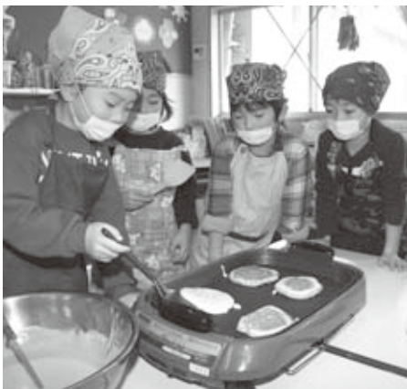
▲上手にフライ返しができるかな

できあがったパンケーキをみんなで食べると「自分でつくるとおいしいね」「またつくりたい」と言いながら、あつという間に平らげていました。