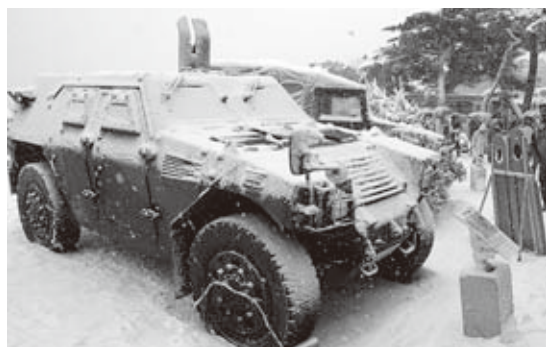
▲災害の際など町旗を掲げて駆けつけます

町のために、有事の際には、町旗を掲げて駆けつけます」と力強く語っていました。 第二十二普通科連隊はかき祭りやハーフマラソン大会など、当町で開催されるイベントなどの際にも町旗を掲げて協力に駆けつけます。