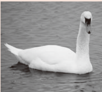
▲人なつこいコブハクチョウ