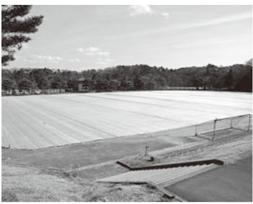
◀天然芝のグラウンドも整備中

整備後には町民開放日を設ける予定で、スポーツの中核都市として県内外からの来客が増えることが期待されています。