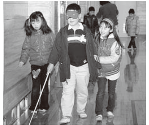
▲アイマスクを付けて視覚障がい者とガイドを体験

体験した児童は、「障がいのある人がどんな苦労をしているのか、自分たちは何ができるのか考えるきっかけになりました」と感想を話していました。