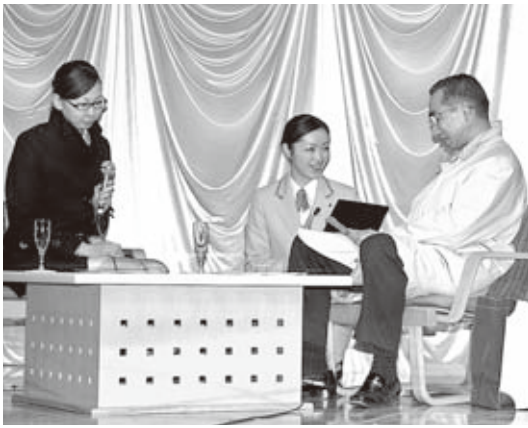
▲参加者が感動のサービスを披露しました

この大会は、社内の大会でありながら、一般の方も観覧し審査に参加できる大会で、地域の接客技術の向上のために開催されました。