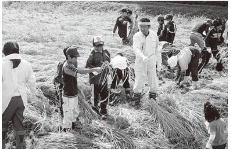
▲第5小学校の稲刈体験