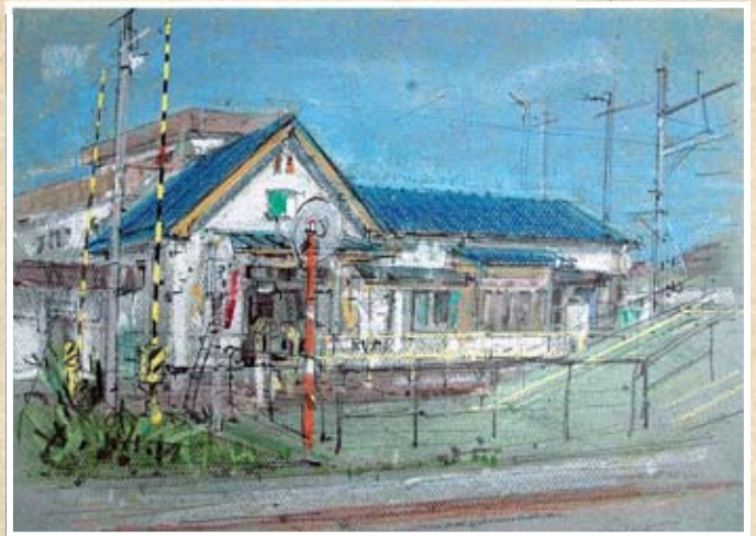
▲高城町商店街の奥にひっそりと佇む高城町駅

仙石線高城町駅 (高城字元釜家五番地) 仙石線の高城町駅は昭和初期に建てられた木造の駅で、昭和三年に宮城電気鉄道(通称・宮電)の駅として開業しました。宮電は昭和十九年に戦時輸送体制強化のため国有化され、現在の仙石線となりました。 高城町駅は構内に踏切があるのが特徴で、スロップでホームとつながっています。 高城町商店街の奥にひっそりと佇む小さな駅舎ですが、多くの町民に利用されています。