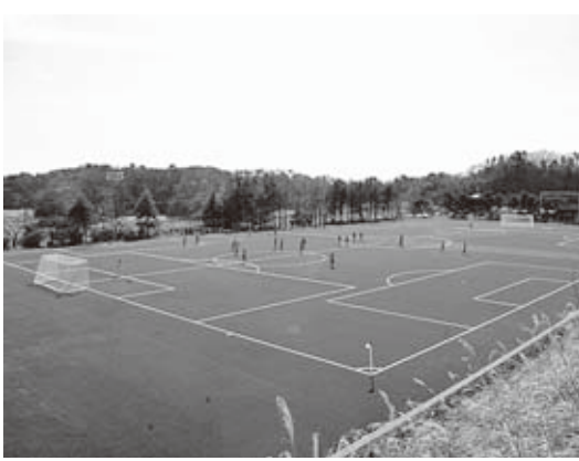
▶人工芝が整備されたグラウンド

整備前は土のグラウンドとして使用されていましたが、より自然の芝に近い状態で体に負担を少なくする素材が使用されています。合わせて照明設備なども改修され見違えるほどのきれいな施設となりました。