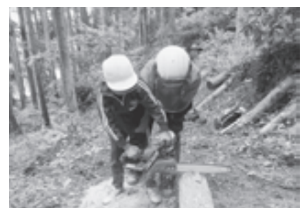
▲おそろおそろチェーンソーを体験する児童