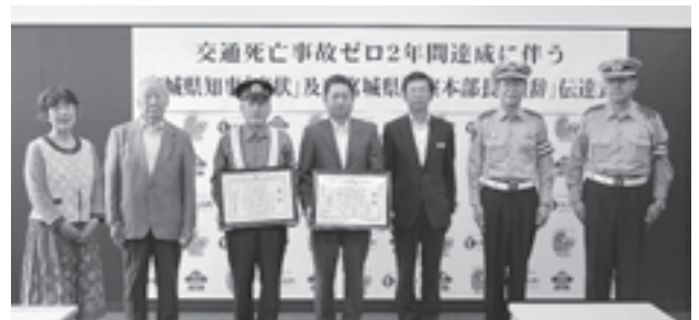
▲記録更新に向け新たな決意です

6 月 8 日、町内での交通死亡事故ゼロが 2 年経過したことから、宮城県知事から「褒状」が宮城県警察本部長より「讃辞」が伝達されました。国道 45 号をはじめ多くの幹線道路が通過している中での記録達成となりました。