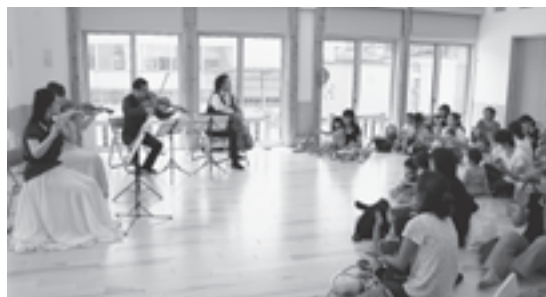
▲はじめて聴くプロの演奏です