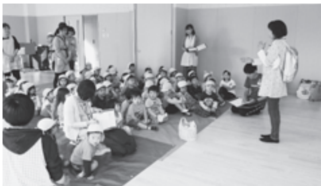
▲子どもたちを災害から守ります