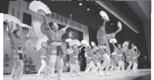
▲仙台すずめ踊りも披露されました