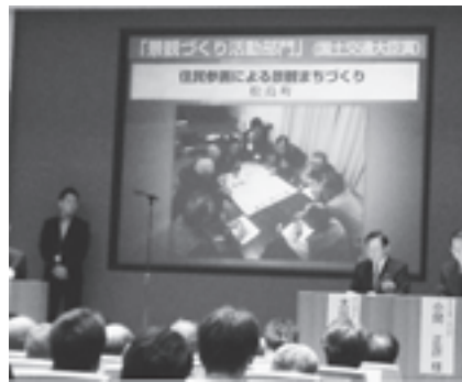
▲会場で松島町の取り組みが紹介されました

景観計画が策定される以前 から、文化財保護法による特 別名勝松島の指定範囲であり また平成14年には松島町観光 振興計画・寺町構想を策定し、 住民による黒板塀への外構修 景や歴史的な趣と調和した家 づくりが行われてきました。 平成21年に景観行政団体へ 移行し、同年から景観計画策 定に向けた取り組みを行って きましたが、平成23年3月11 日に発生した東日本大震災の 影響により一時中断。しかし 自宅や店舗の再建をいち早く 始めた住民から震災前まで行 われていた景観の取り組みは