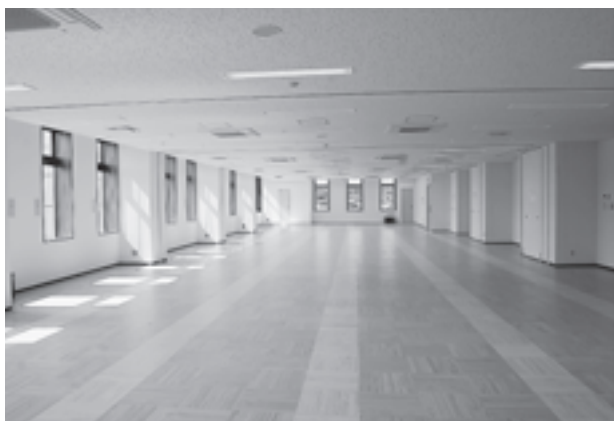
▲3階の多目的スペース 5つの部屋に区切ることが可能です