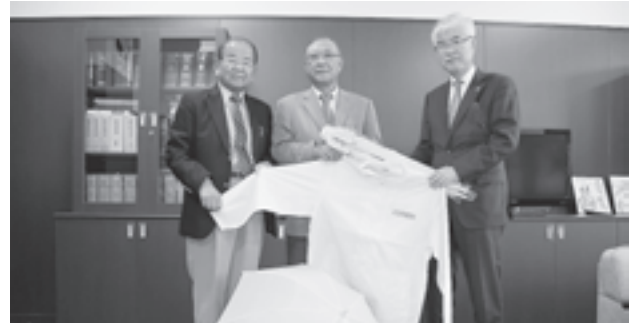
▲小池教育長（右）と宮城県自動車協会の皆さん

5 月 25 日、（一社）宮城県自動車協会から、児童向けのカサや合羽などの雨具の寄贈を受けました。