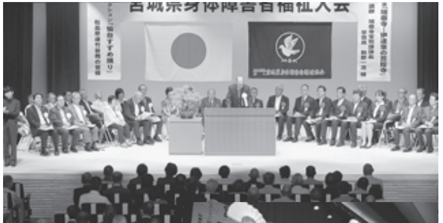
▲松島で初の開催となった宮城県身体障害者福祉大会

「松島町歴史文化教育」の一環として町内の小学校3校の5年生を対象とした森林学習が始まりました。今年度はじめて参加した第一小学校の児童たちは、檀山の美林見学・チェーンソー体験などを通して、樹木の名前や間伐について楽しみながら学習しました。今後第二小学校・第五小学校でも実施します。