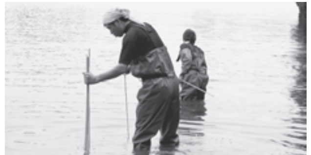
▲板碑を調査中です

教育委員会では現在、瑞巖寺・東北学院大学が共同で行ってきた雄島周辺の海底に沈んでいる板碑の引き上げ調査に参加しています。石造の供養碑である板碑は、地域の歴史を研究するための手がかりとして貴重な資料・文化財とされており、今後も継続して参加する予定です。