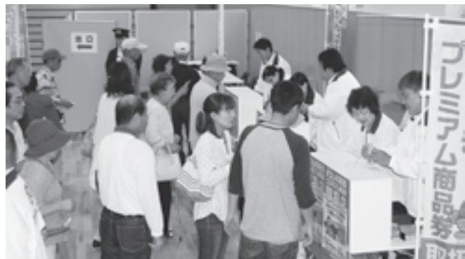
▲大盛況だったプレミアム商品券