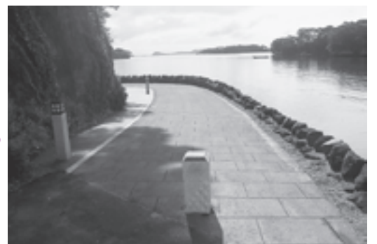
▲景観へ配慮して整備されたウォーキングトレイル

今後とも、町民の皆様や事 業者の方々と協働して、より 良い松島の景観形成を推進し てまいりますのでよろしくお 願いいたします。