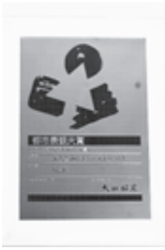
▲授与された表彰盾

都市景観大賞「景観づくり 活動部門」は、景観法制定10 年を迎えた平成27年度にはじ めて設定されました。住民が 主役の景観づくり活動等、景 観法や景観に関連する制度を 活用した優れた取り組みを選 定・顕彰し、広く一般に公開 することにより、より良い都 市景観の形成を目指す部門で す。