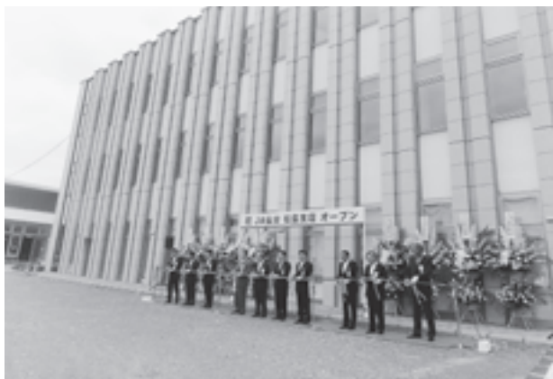
▲6月22日に行われたJ A 仙台のオープニングセレモニー

建物はJ A 仙台と松島町の区分所有となり、2階の一部と3階のすべてを町が管理する避難所です。津波や洪水などの災害発生時に約320人の避難者を収容できる施設として、地域住民等の安全を確保するため整備されました。