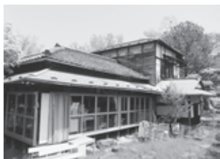
現状の観瀾亭分室

の改修計画では、歴史的価値のある部材等は手ばらしで解体し清掃後に再使用する工法を採用します。以前の改修によって金属屋根に葺き替えられた屋根については、建設当時の屋根を再現するため耐久性の高い瓦と銅板を使用します。また調査の結果、地震に対する耐力度が不足していましたので、今回の改修計画と合わせ耐力壁による補強工事も行います。