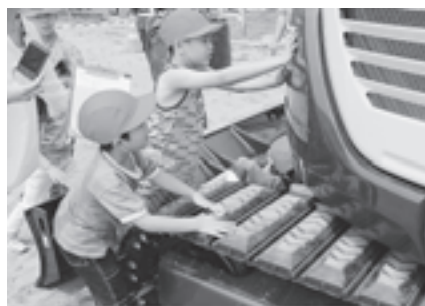
▲ピカピカのショベルカーに夢中の児童たち