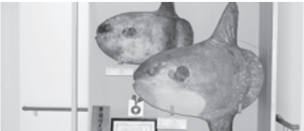
▲寄贈されたマンボウの剥製