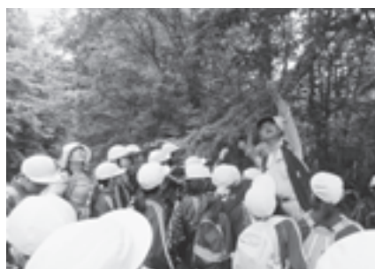
▲クイズを交えながらの樹木説明を受けました