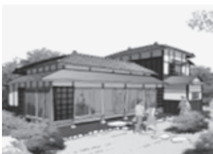
改修後の観瀾亭分室イメージ