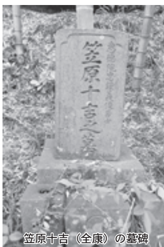
笠原十吉 (全康) の墓碑