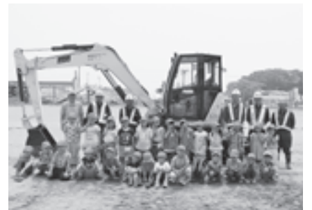
▲かっこいい「働く車」を見せていただきありがとうございました