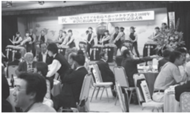
▲五大堂太鼓の披露もあり会場はお祝いモードに包まれていました