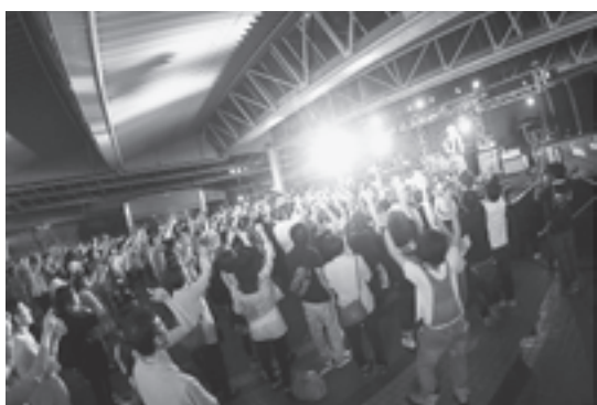
6月13日には、前夜祭SPECIAL LIVEが旧マリニピア松島水族館で開催されました。有名アーティストの共演は、松島パークフェスの成功へ弾みを付けました。

「町民の方でも松島海岸を歩く機会はありませんかと思うので、このようなイベントで新たな松島の一面を知ることができるとなると嬉しいです。また町外から来る方も、松島に対して良いイメージも持ってもらえれば、また足を運んでくれるかもしれない。継続していくことが大切だと思っているので、これからも『皆が楽しめる音楽イベント』を続けていきたいです」