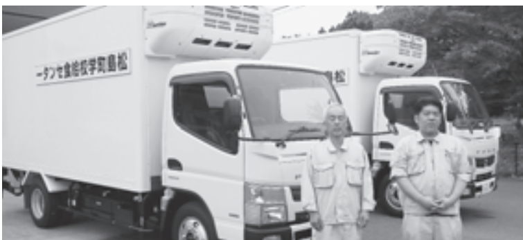
▲新しくなった配送車