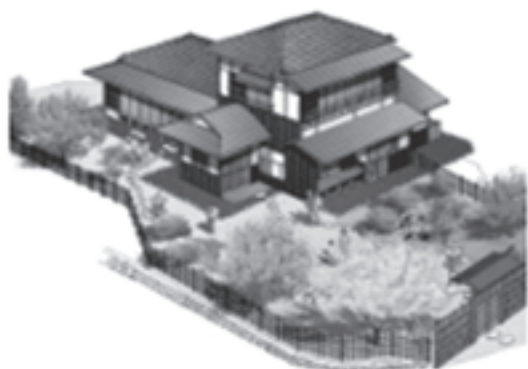
改修後の全体イメージ図

災害の際に住民と観光客が避難できるように観瀾亭分室の大規模改修工事を行います。完成予定は平成28年3月です。