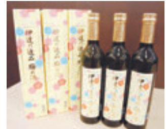
▲女性にも飲みやすい爽やかな甘さが広がる梅の酒