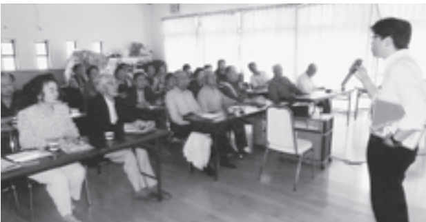
▲講習会を開いた初原老人クラブ長生会の皆さん

6 月 15 日、初原老人クラブ長生会で、塩釜警察署署員を招き特殊詐欺の被害を受けないための講習会が開催されました。講習会では塩釜署員の詐欺被害の防止策を参加者の皆さんは熱心に聞き入っていました。