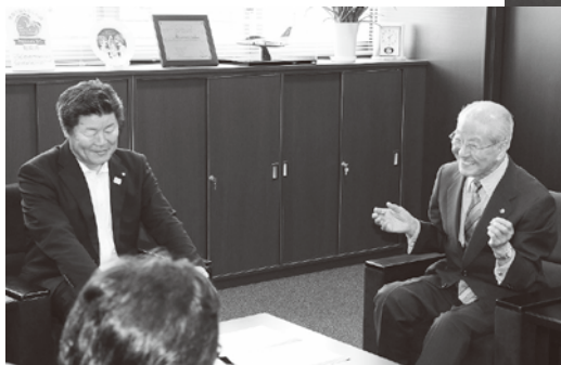
▲平成30年には瑞巖寺落慶法要で狂言を披露します