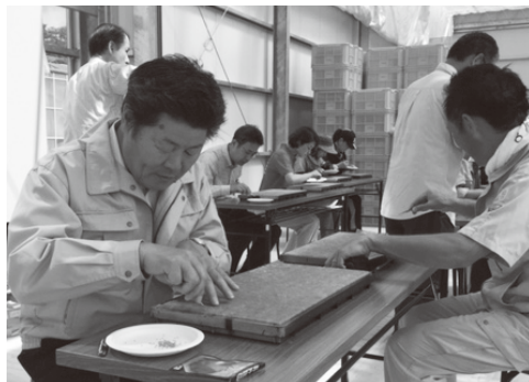
▲櫻井町長もトマトの種まきに挑戦しました