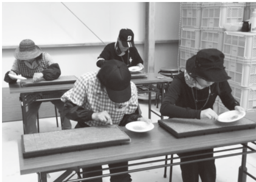
▲専用のマットにトマトの種をまきます