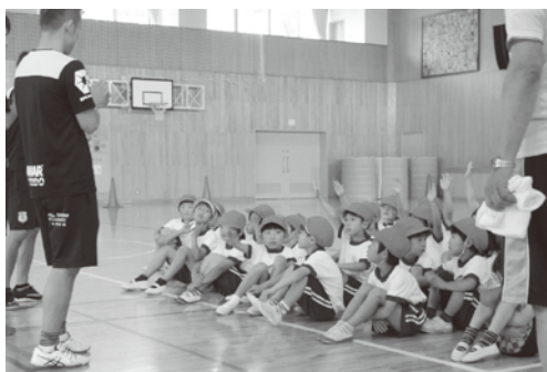
▲話を真剣に聞く児童たち