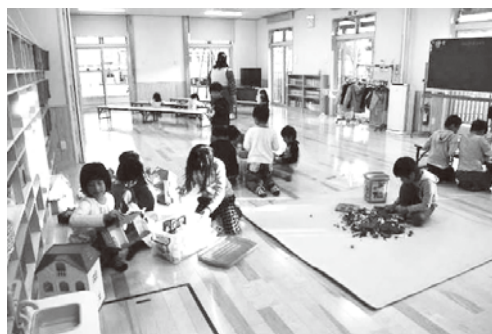
■放課後児童クラブ