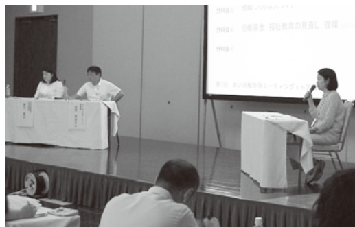
▲全国から約300人の関係者が集まりました

会合では、共同募金が果たした被災地支援の役割や、今後の共同募金が地域支援で果たしていく内容などについて報告が行われました。