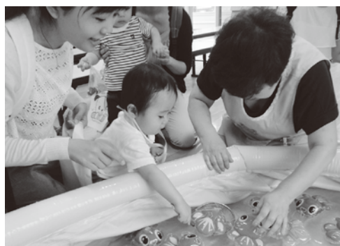
▲うまく釣れるかな？