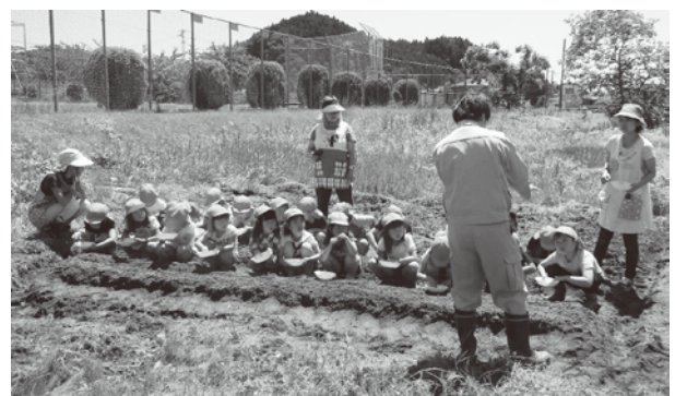
▲みんなでニンジンの種まきをしました

食育の一環として町内の各幼稚園で、にニンジンの種まきを行いました。野菜に親しみ、偏食の改善などを図るものです。仙台農協営農センターの指導のもと、園児一人ひとりが種をまき、大きくなることを願いました。秋に収穫し、給食で食べるのが楽しみです。