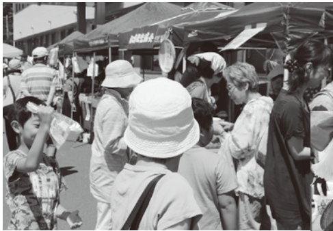
▲多くの方が来場した今年最初の「まつの市」