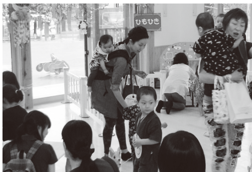
▲親子で楽しめた「なかよしまつり」