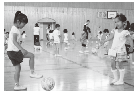
▲パス練習も上手にできるようになりました

また7月5日、12日には、第一幼稚園でヴォスクオーレのチアガールズによるチア教室が行われました。園児たちは先生の動きに合わせて元気いっぱいにダンスを踊りました。