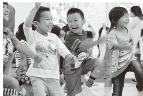
▲笑顔いっぱいでチアを踊りました