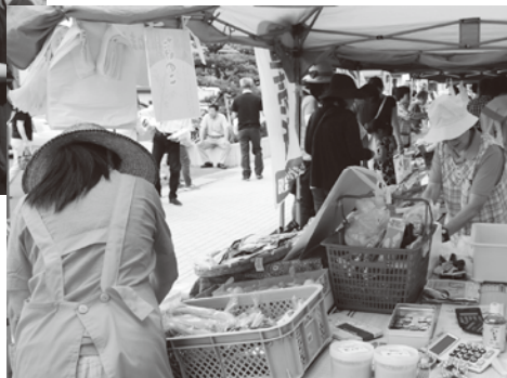
▲新鮮な地場産品がお値打ち価格で販売されています