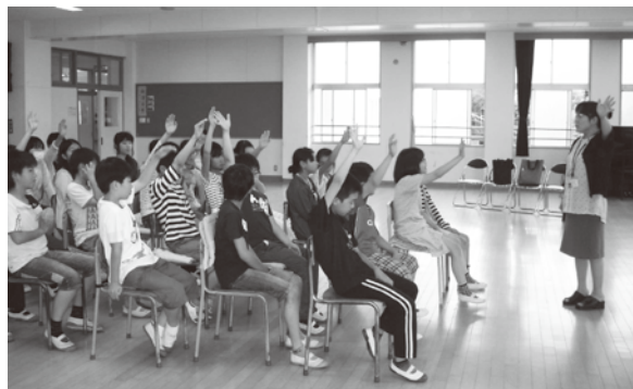
▲認知症について学んだ6年生の皆さん

7月14日、松島第一小学校6年生の皆さんが町の保健師から認知症の特徴や接し方を学びました。