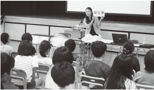
▲いのちについてお話しいただきました

6月29日、松島第五小学校を会場に平成28年度学び支援事業「学び支援親子研修会」が開催されました。