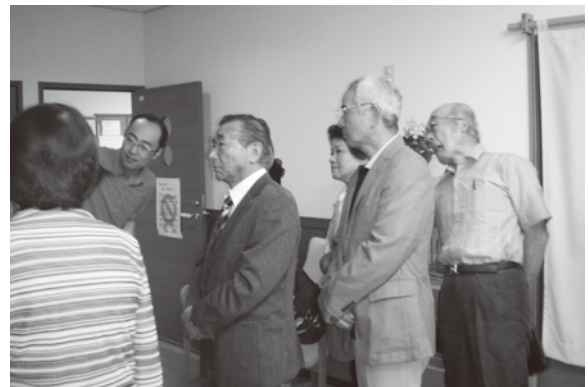
▲施設を見学した民生委員児童委員の皆さん

6月20日に松島町民生委員児童委員の研修として、利府町と大郷町にある介護老人保健施設と特別養護老人ホームを訪れました。施設では福祉に関する支援の在りかたなどを研修し、その後多賀城市の子育てサポートセンターも訪問しました。