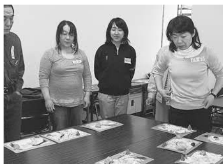
▲作成した枯山水を見てもらう受講生

ハーブの栽培を学ぼう」が開 催されました。 キムチ作りの後にハーブに ついての説明と植え付け体験 が行われました。参加者は 「育ったハーブを料理に使っ てみたい」とハーブの成長を 心待ちにしていました。