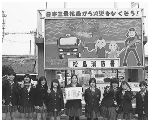
▲松島高校のみなさん