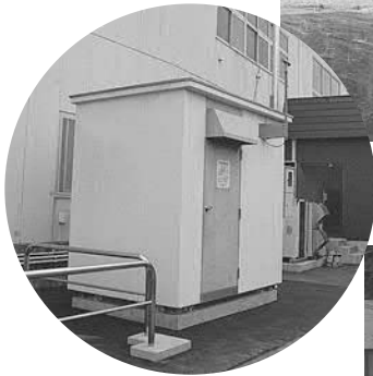
▲勤労青少年ホームに移設された震度計