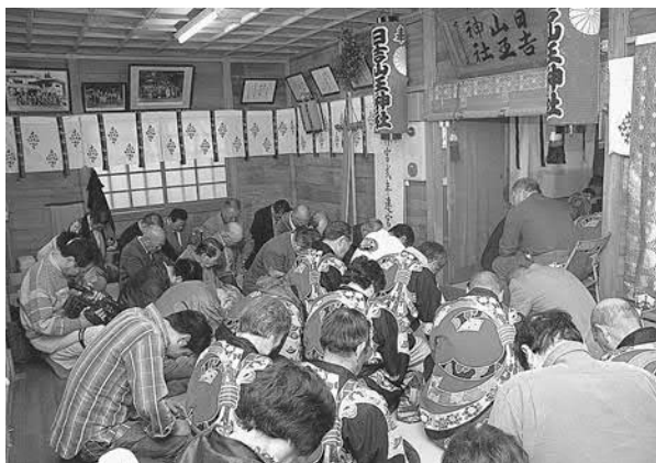
▲双方の関係者が参列して神事が執り行われました

月山神社の釣り鐘は一八二八（文政一一年）に奉納されましたが、戦時中に軍事供出され、日吉山王神社に安置されていました。