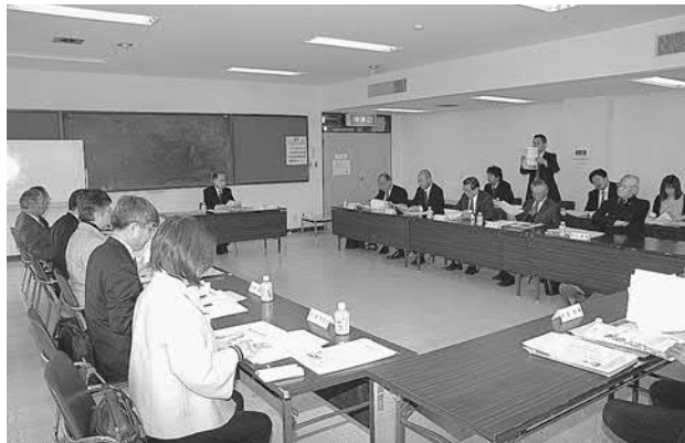
▲活発な意見が交わされました