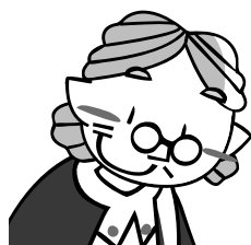
楽ラク健康教室参加 80代 女性

参加する前はとても不安な気持ちでした。教室が終わった後は、新しいことに挑戦して“できた”ことがうれしくて自信が持てました。