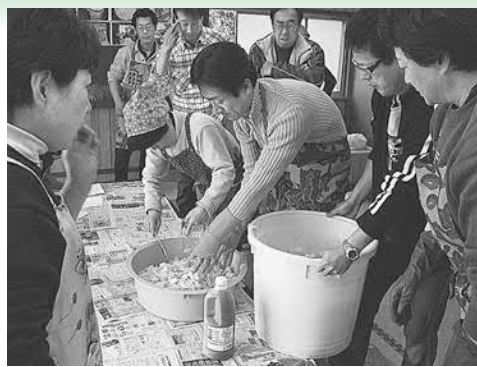
▲男性陣もキムチづくりに参加

三月十三日に中央公民館と いちようの会共催で「手作り 教室・キムチ作り」が蒲サプ センターで開催されました。 レシピを片手にエプロン姿 のお父さん達も一緒にになり、 本格的キムチ作りに挑戦。参 加者は「キムチがで出来上が るのが待ちきれない」と話し ていました。 また、三月二十七日に手樽 地域交流センターを会場に手 樽区と共催の「漬物教室&