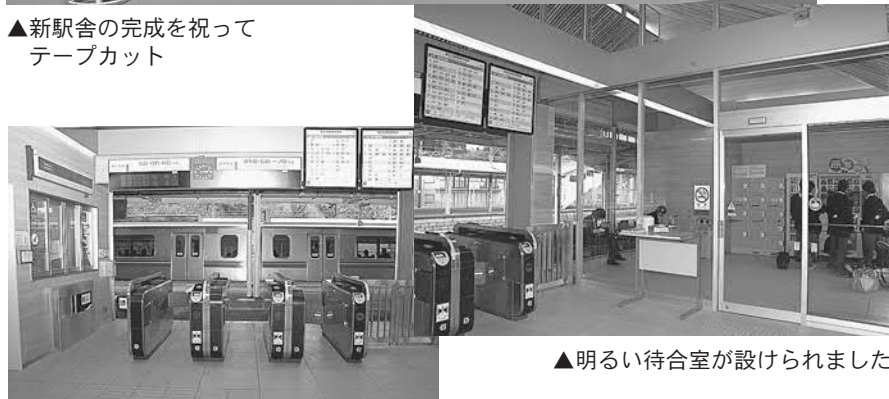
▲明るい待合室が設けられました