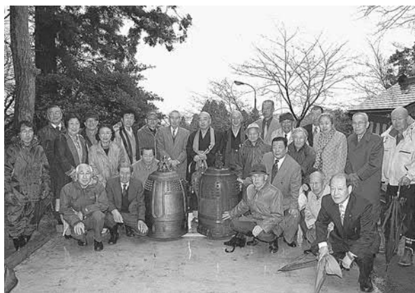
▲返還される釣り鐘（右）と代替される新しい釣り鐘

釣り鐘は青銅製で約三百キロあり、雨が降りしきるなかお互いの氏子がかげ声をかけながら力を併せて神社の階段を上げ下ろしを行いました。