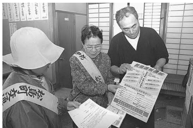
▲飲酒運転撲滅のチラシを配付する交通安全母の会の皆さん