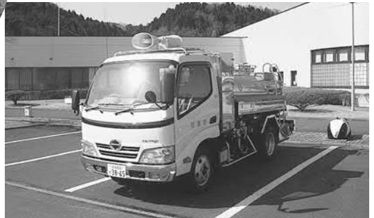
▲加圧式給水車の配備により、災害時の応急給水の用途が広がりました