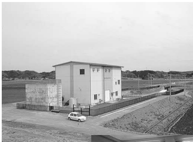
▲冠水被害の軽減にも 大いに期待されます (県営湛水防除事業 で整備された幡谷排 水機場)