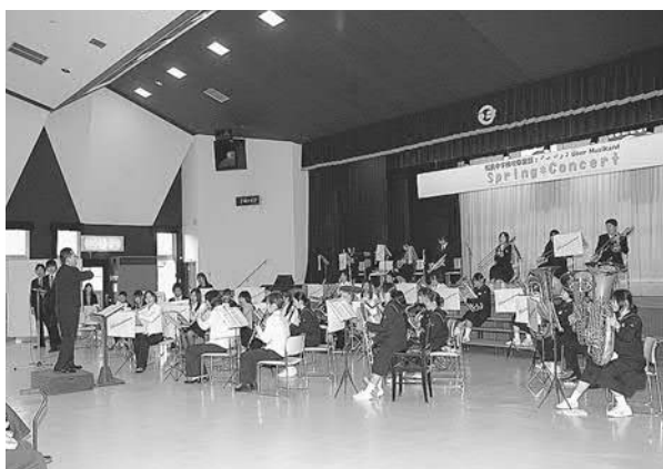
▲素晴らしい演奏を披露した松島中学校吹奏楽部の皆さん

松島中学校の吹奏楽部が、三月二十二日に中央公民館でスプリングコンサートを開催しました。平成二十一年度の吹奏楽のしめくりとして、部員だけでなく卒業生も参加し、時代劇のテーマ曲などの親しみやすい曲の演奏を取り入れる趣向をこらした内容で盛り上がり、何度もアンコールを受けていました。松島中学校吹奏楽部は平成二十一年度に開催された全日本吹奏楽コンクール宮城県大会石巻地区大会で金賞に輝き、県大会でも銀賞を受賞するなど活躍しています。