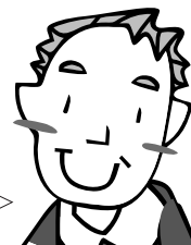
歯つらつ健康教室参加 80代 男性

元気だと、旅行や温泉など、楽しみがあるので得です。このような教室に参加することは健康の維持のために効果的だと思います。