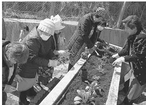
▲ハーブの植え付けを体験しました

三月十三日に中央公民館と いちようの会共催で「手作り 教室・キムチ作り」が蒲サプ センターで開催されました。 レシピを片手にエプロン姿 のお父さん達も一緒にになり、 本格的キムチ作りに挑戦。参 加者は「キムチがで出来上が るのが待ちきれない」と話し ていました。 また、三月二十七日に手樽 地域交流センターを会場に手 樽区と共催の「漬物教室&