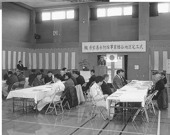
▲完成式では大橋町長が「農家の皆さまはもとより 地域防災にも資するものです」と祝辞を述べました