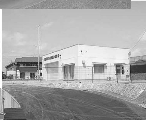
▲第五分団の消防車倉庫（幡谷）