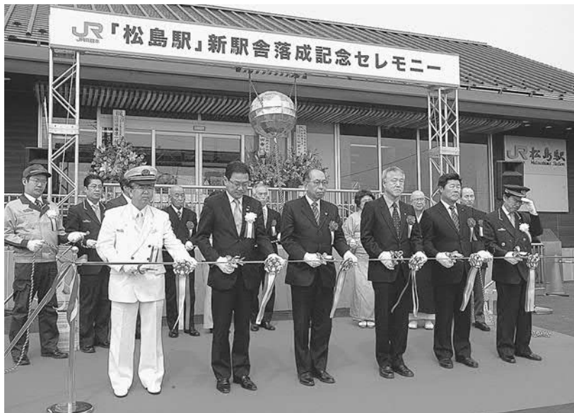
▲新駅舎の完成を祝って テープカット