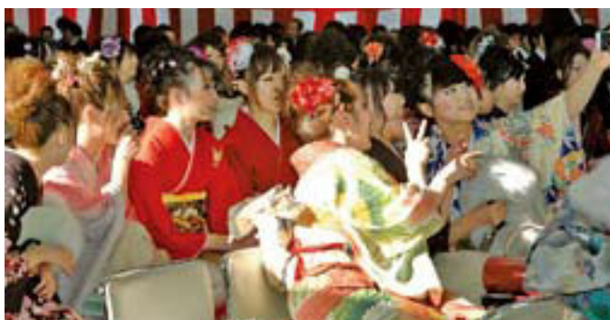
▲会場の至る所で記念撮影が行われていました