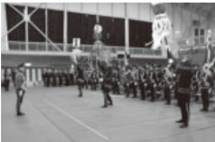
▶威勢の良い纏振り