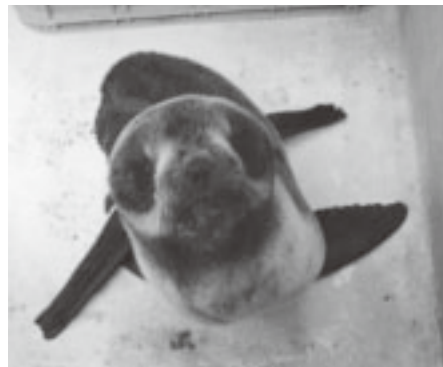
▲「タロちゃん」の様子は、水族館のホームページの「マリンピア日記」で紹介しています（一般公開はしていません）