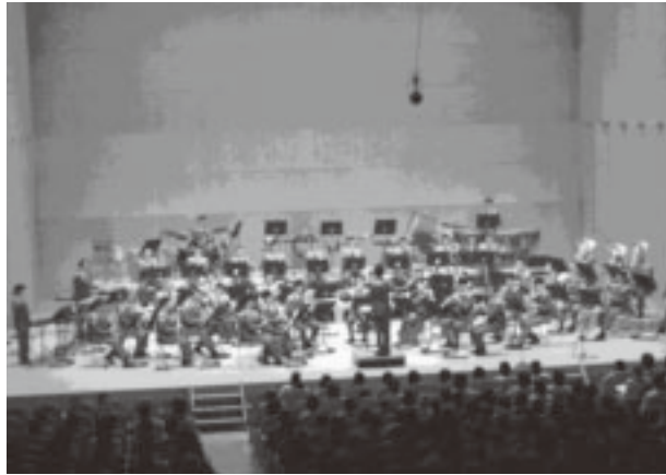
▲迫力ある生の演奏をお楽しみください

一昨年、大変好評でした陸上自衛隊東北方面音楽隊による「ふれあいコンサート」を今年も開催します。迫力ある生の演奏をお楽しみください。