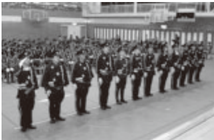
◀力強く宣誓した新入団員の皆さん