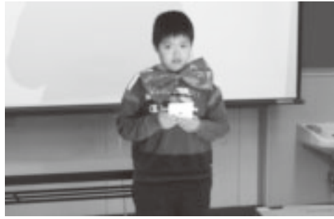
▲覚えたてのマジックを披露

して楽しんでいました。最後には蝶ネクタイを付けてマジシャンに扮した参加者が練習の成果を披露すると、拍手喝采で大いに盛り上がりました。また、冬休み映画教室ではアニメ『あらいぐまラスカル』や「ガキ大将行進曲」を鑑賞し親子の絆を確かめ合っていました。参加した小学生は「冬休みの良い思い出になりました。覚えた手品を友だちに披露したい」と話していました。