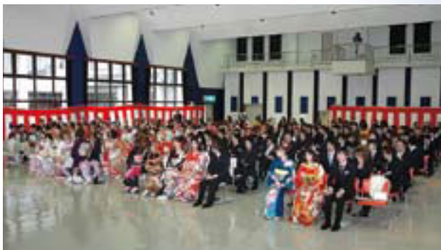
▲厳粛な雰囲気での式典となりました