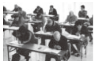
▲松島の観光博士を目指そう