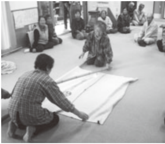
▲本郷区居網地区の自主防災組織による防災訓練の様子（応急担架の作製体験）

また、十九人が犠牲になった平成十五年の水俣市の土砂災害では、自主防災組織があった地域に犠牲者はいませんでした。災害の規模が大きくなるほど、専門