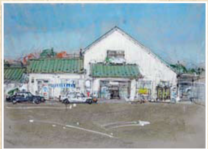
▲旧国鉄時代から通勤通学に利用された松島駅

(松島字小梨屋七番地) 四 新しい駅舎が建設中の東北本線松島駅。既に取り壊された古い駅舎は、木造平屋で、高さの違う三段の切妻屋根と明かり採りのステンドガラスが特徴的な駅舎でした。昭和十九年に東北本線海線開通に伴い信号所が置かれ、昭和三十一年に「新松島駅」として開業。昭和三十七年に山線が廃止されてからは「松島駅」に改称されました。旧国鉄時代から多くの町民が通勤通学に利用する松島駅。日本三景松島にふさわしい駅舎として生まれ変わります。