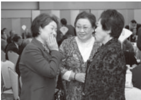
◀新年の挨拶を交わす皆さん

出席した町民の皆さんは、日本舞踊松宮流幸扇会の皆さんの新春にふさわしい祝賀の舞を鑑賞しながら、新年のあいさつを交わしていました。