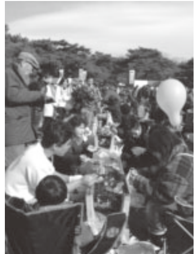
▲炉端コーナーでは旬の魚貝類が味わえます