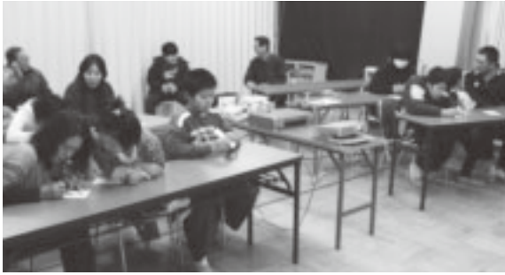
▲マジックの道具づくりから体験しました

十二月二十六日に手樽地域交流センターで親子手づくりマジック教室&冬休み子ども映画教室が開催されました。手づくりマジック教室では、公民館職員の指導でマジック用のトランプ作りや実演を体験し、参加者は覚えたてのマジックを親子で見せ合うなど