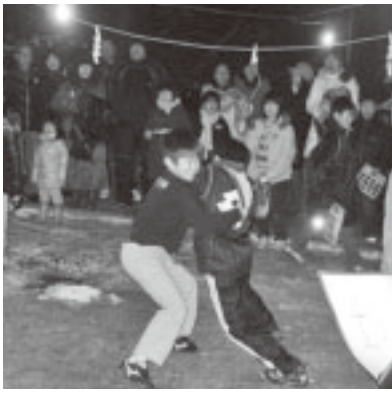
▲数十年の歴史をもつ日吉山王神社の奉納こども相撲

また、紫神社では、豪華景品があった初夢チャリティーどんとくじの抽選会が行われ、当選くじが発表される度に会場は歓声に包まれ、大いに盛り上がりました。