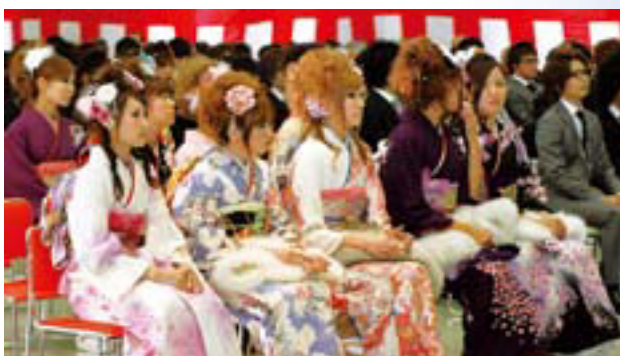
▲振り袖姿で会場は鮮やかに彩られました

になったということは社会に対し責任と義務を負うとともに権利も得たこととなります。社会人としての言動に努めていただきたいと願っています。