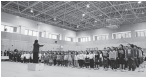
▲全校生徒による合唱で新しい体育館の完成を祝いました

11月から供用が開始されている第一小学校体育館の落成記念式典が11月19日に行われました。