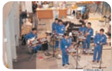
▲避難所の音楽隊の慰問(温水プール美遊)

大災害を前にして不安に駆り立てられた私たちに、復興に向けて立ち上がる勇気を与えていただいた自衛隊の皆さんには本当に感謝の気持ちでいっぱいです。支援活動にあたった隊員の皆さんの姿は深く心に残ることでしょう。