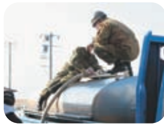
▲給水活動の様子(二子屋浄水場)

東日本大震災の発生直後から、144日にわたり活動を続けてきた自衛隊が8月に活動を終えて宮城県から撤収、災害派遣のプレート掲げた自衛隊の車両を見かけることがなくなりました。