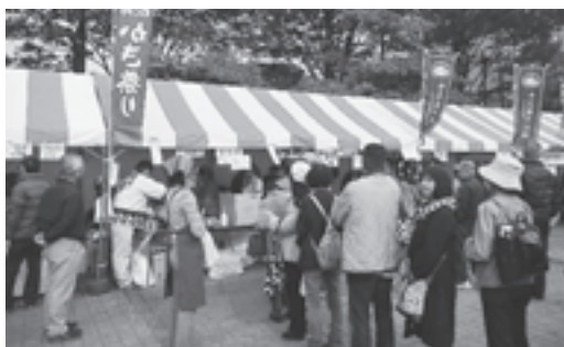
▲行列が出来た松島町のかき汁

十一月八日、九日の二日間、仙台市勾当台公園で開催された仙台鍋まつりに松島町からかき鍋を出店しました。 仙臺鍋まつりは仙台地域の十二市町村が一堂に会し、各地域が自慢の鍋を販売します。松島産のかきをたっぷり使っ