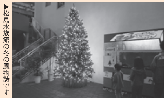
▶松島水族館の冬の風物詩です

マリニピア松島水族館の冬の風物詩「デンキウナギのクリスマスツリー」が11月13日からスタートしました。