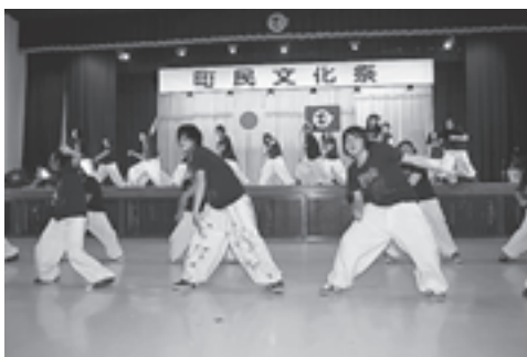
▲初出場の松島高校ダンス部