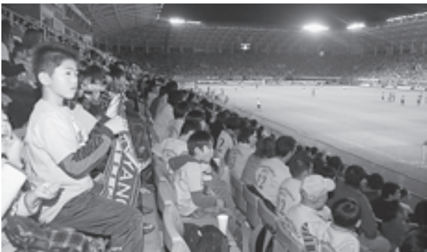
▲選手が一息懸命プレーする姿に感動

選手の一息懸命プレーする姿に参加者も感動した様子で、「上位に進出しアジアチャンピオンズリーグの舞台でも戦ってほしい」と話していました。