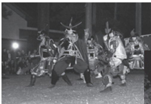
▲伊達武将隊も応援に駆け付けてくれました