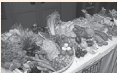
▲松島産の食材がズラリ

また、四季彩食松島料理コンテストの入賞者の表彰式が行われ、松島三ツ星冬ランチのグランプリ作品が展示されました。