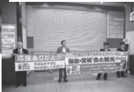
▲「応援ありがとうございます」の垂れ幕も掲げました