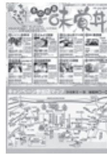
▲味覚井キャンペーンチラシ

松島産筍の製品化は、竹林の環境保全と資源の有効活用が図られ、新しい松島の特産品として期待されています。