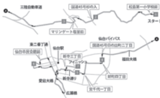
通過場所と予想通過時刻

大会コースは松島町中央公民館を出発し、仙台市までを結ぶ42.195kmです。各チームの選手がたすきをつなぎゴールを目指します。