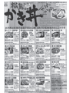
▲かき井キャンペーンのチラシ

から元気と美味しさを発信し、宮城県、そして東北を元気にしていこうと今年も実施することになりました。 かき井は松島の家庭で昔から親しまれている地元の井。卵とじやひつまぶし、天井風、カツ井風、洋風など、町内十五店舗の工夫を凝らした一品を味わえます。