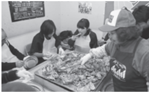
▲プリプリのかきが味わえます

東日本大震災の影響により松島湾のかきの養殖棚が甚大な被害を受け、今年の営業が見込めない状況でしたが、楽しみにしている多くの方々の