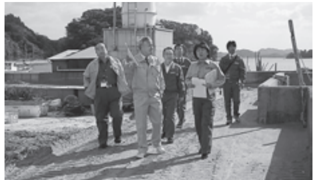
▲早川漁港の護岸施設を視察する郡本部長（右から2人目）

郡本部長は「今後、松島町が考えている事業にどのような課題があるのか話し合いながら、国で考えている支援策など、積極的に協力していきたいので相談してほしい」と話していました。