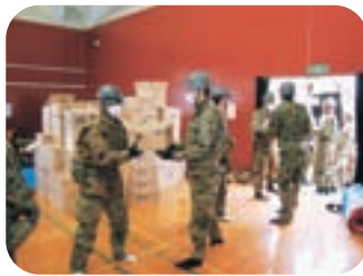
▲支援物資の搬入作業(海洋センター)