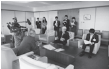
▲矢田立郎神戸市長を表敬訪問