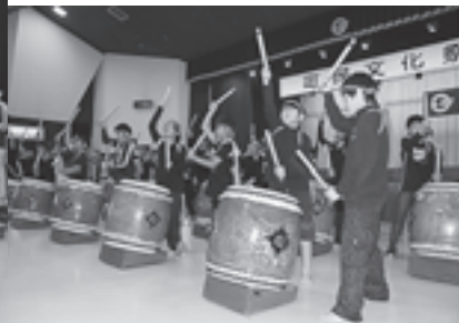
◀第一小学校の児童による太鼓演奏