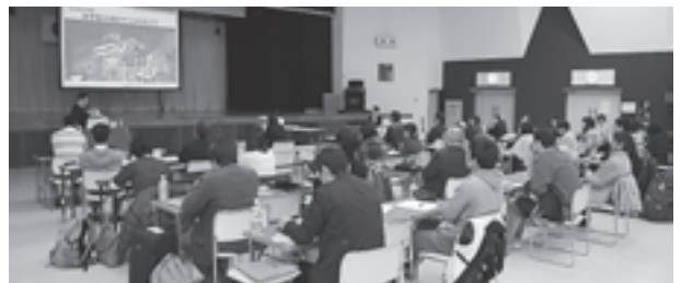
▲全国から訪れた会員が研究の成果を発表

勇魚会(いさなかい)が主催するシンポジウム「みちのくの海と水族館の海棲哺乳類」が11月19日と20日の2日間、中央公民館とマリニピア松島水族館を会場に行われました。