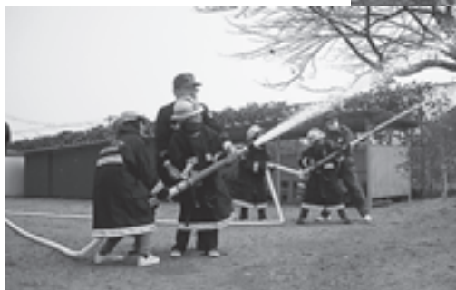
◀ホースを使った消火訓練（二小）