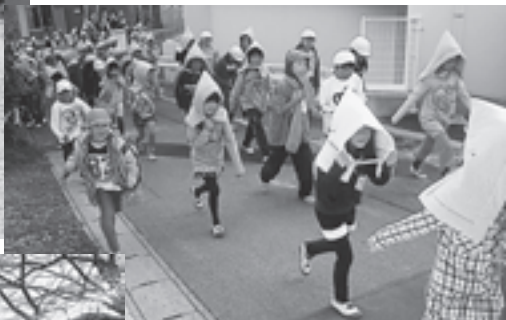
▲第一幼稚園園庭への避難訓練（一小）