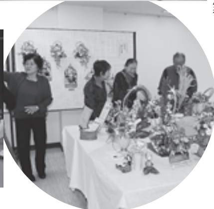
▲力作が所狭しと展示されました