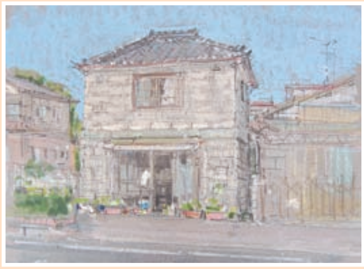
▲頑丈な岩造りの建物が特徴です

旧正宗食堂(松島字小梨屋) 旧正宗食堂は、昭和二十九年十二月に野蒜岩を使って建てられた岩造りの建物です。最初は牛乳や菓子、パンを売っていましたが、松島駅で二十四時間の勤務を終え、明け方に帰宅する駅員さんに酒をふるまう始めたことがきっかけで、そば屋兼居酒屋となり、そして正宗食堂が誕生しました。 ラーメンやジンギスカンなど幅広く常連客に提供していた当時の正宗食堂。珍しい岩造りの重厚な建物は、常連客でにぎわった当時の様子を感ぜさせます。