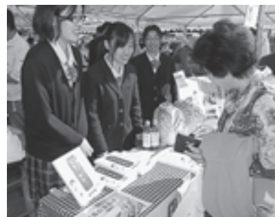
▲明成高校の生徒が松島白菜餃子を販売