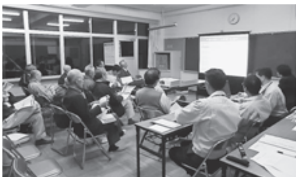
▲担当者の説明に耳を傾ける出席者（手樽地区）

想定する津波の高さや防潮堤の高さ、避難の方針などについて、各地域で活発に意見が交わされました。