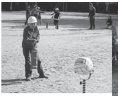
▼水消火器による消火訓練（五小）