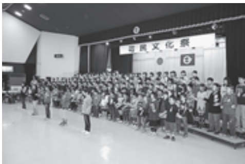
▲第二小学校の児童は手話を交えた合唱を披露