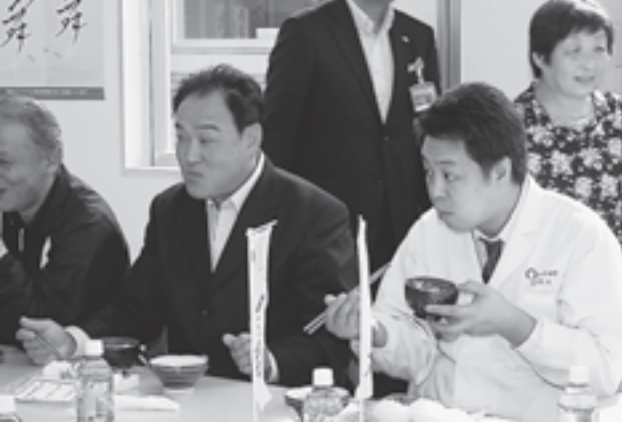
▲新米のおいしさに思わず笑顔が

環境保全米とは？ 「環境保全米」とは、農林水産省のガイドラインに基づき、通常の栽培方法に比べて、化学合成農薬の使用回数が二分の一以下で、化学肥料の使用量が五割以下の栽培方法で生産されたお米です。