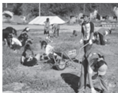
▲雑草取りに汗と流す第2班の生徒たち

夕貝の駆除作業、午後は関係者から漁業の復興状況と原発の風評被害等の講話を聞いた後、暑さの中で雑草取りと整地作業などの環境整備に汗を流しました。 作業終了後の松島フットボールセンターでのお別れ会では、全員で記念撮影後、「出会いを大切にこれからも頑張りますよ」と、堅く誓い合い、今回のボランティア交流を締めくくりました。