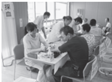
▲コミュニケーションを取りながら

また、今回受診できなかった方々を対象に追加健診を実施します。詳細は、21ページをご覧ください。