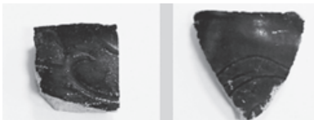
▲出土した瀬戸物の破片