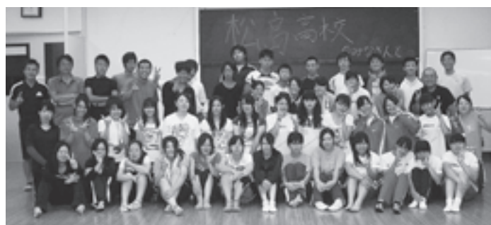
▲出会いを大切に…全員で記念撮影

第二班は、卒業生三名を含む舞子高校二十七名と神戸学院付属高校の七名で編成され、八月十九日に来松。翌二十日、松島高校生徒会とボランティア部と合流、バスで東松島市宮戸月浜地区へ移動しました。合同チームは、午前中、サリの天敵サキグロタマツメ