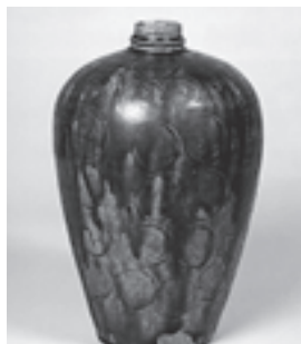
▲参考：完全な形 愛知県陶磁美術館蔵