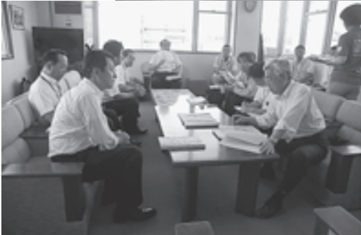
▲高平副町長と意見交換会をする峰久事務次官(右)