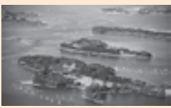
▲松島湾（西行展しの松公園より）