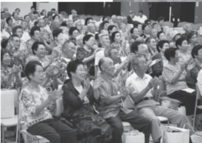
▲多くの方が会場に足を運び、楽しいひとときを過ごしていました