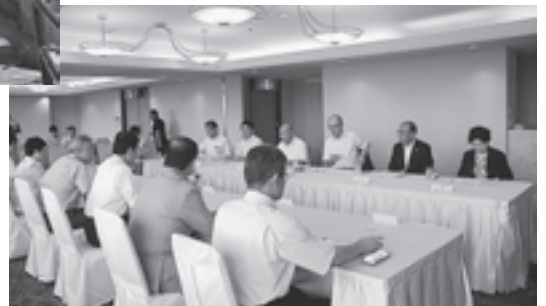
▲本町のさまざまな分野の有識者と意見交換を行いました