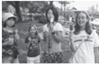
▲ホストファミリーと一緒に