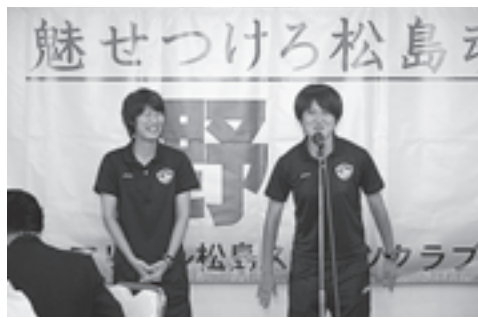
▲下子鶴キャプテンも応援に駆け付けました