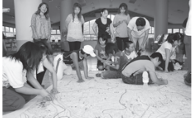
▲地域の危険箇所を印をつける松島第二小学校の児童たち

作成した地図は、校内の廊下に掲出し、子どもたちが常に危険箇所を意識できるようにしています。