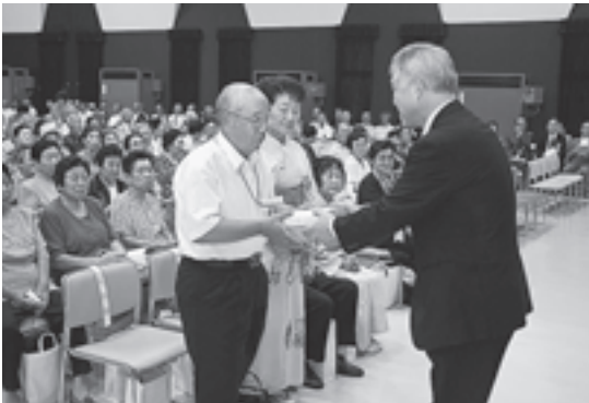
▲大橋町長から記念品が手渡されました