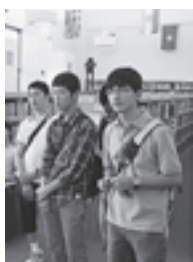
▲高校の見学ツアー