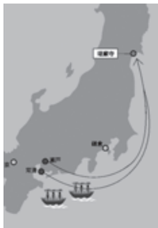
▲陶器生産地と松島