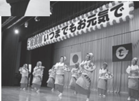
▲松島舞踊会の皆さんによる花笠音頭