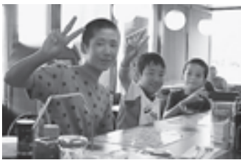
▲食事も異文化体験