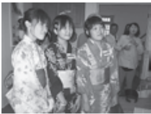
▲浴衣で日本文化を伝えます