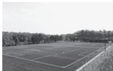
松島フットボールセンター

●問合先 松島町町民福祉課ねんりんピック推進室 ☎022 - 355 - 0666