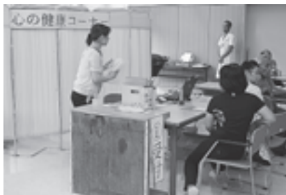
▲心の健康コーナーも好評でした