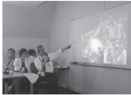
▲松島の魅力を紹介する大橋町長