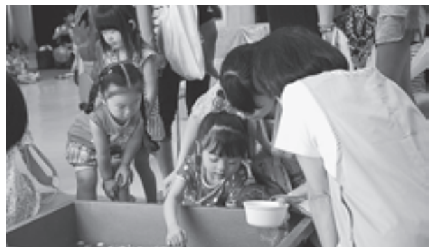
▲上手にすくえるかな

参加した親子は大きな輪になり盆踊りを楽しみ、その後、ボーリングやスーパーボールすくい、水ヨーヨーすくいなどたくさん並んだ出店をまわり、子どもたちは笑顔で元気いっぱい走り回っていました。