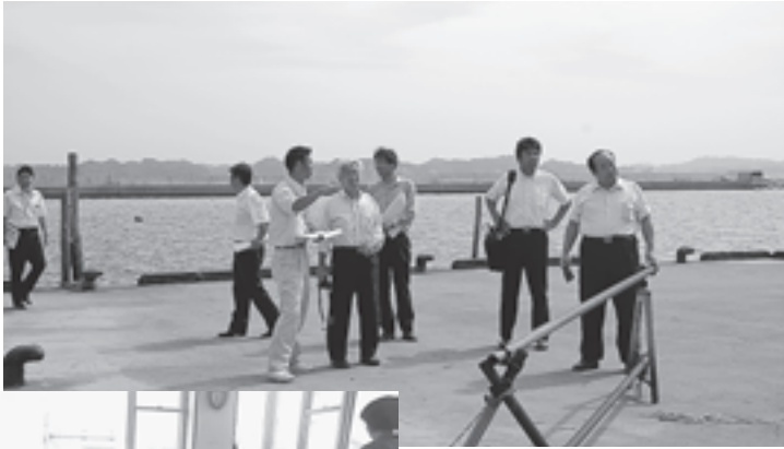
▲漁港などの現状を視察

峰久事務次官は、「さまざまな課題があると思いますが、復興庁と宮城復興局と協力しながら、地域の早期復興を支援したい」と話していました。