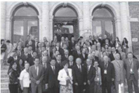
▲第3回日仏自治体交流会議に出席した首長

今回の震災では、島々に守られ、国内外の方々に助けられました。今度は、松島町民やそこに働く人たちが自然と歴史・文化を守り、松島の良さを世界に発信し、松島への来訪者に感謝の気持ちを届けたいと思います。そして、感動を覚えてもらえるような国際観光地を目指していきたい」と、町の紹介や東日本大震災から復興へ向けて立ち向かい、観光から再生を図る姿