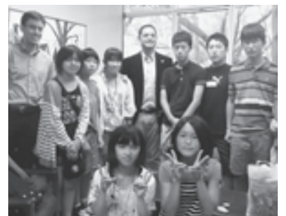
▲チャペルヒル町長へ表敬訪問