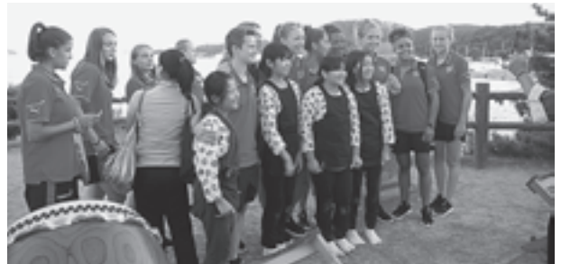
▲スイス代表のメンバーと一緒に

8月19日から、日本を会場に行われた「2012 F I F A U-20女子ワールドカップ」。同大会に出場しているスイス代表が8月20日に来松し、五大堂などを拝観しました。五大堂例大祭が行われた当日、五大堂太鼓の子どもたちと一緒に写真撮影をするなど、松島でのひと時を堪能していました。