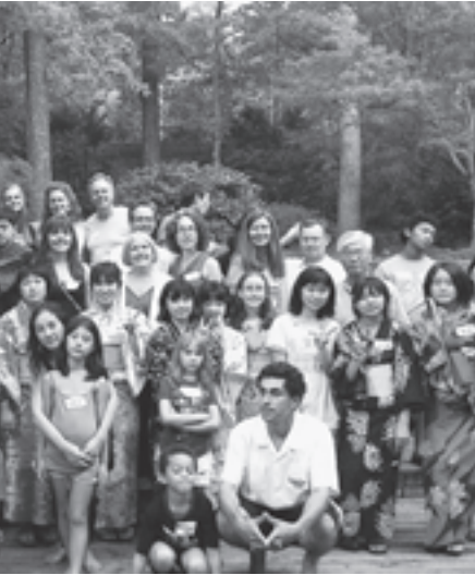
▲現地の日本クラブの皆さんによる心温まるおもてなしで歓迎会をしていただきました。

長い移動時間を経て、アメリカの地に降り立つと、見るもの聞くものが全て英語です。最初は戸惑いを見せていた生徒たちでしたが、本場の英語にも徐々に慣れ、ジェスチャーを交えながらコミュニケーションを取る姿がみられました。「自分の英語が通じた！」と喜びの声も聞かれました。