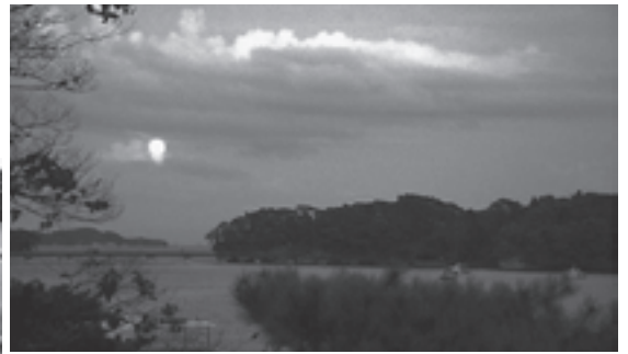
▲満月が顔を出しました