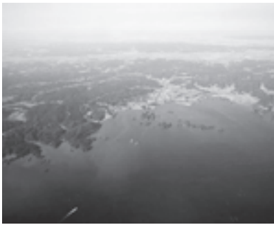
▲このすばらしい松島湾を世界に向けて発信しましょう！

1997年に湾を活用した観光振興、地球環境保護や観光資源の保全を目的にフランスのヴェンヌ市（モルビアン湾観光局）に本部を置く「世界で最も美しい湾クラブ」が設立されました。ユネスコと連携した活動も行っています。現在、フランスのモンサンミシエル湾をはじめベトナムのハロン湾、アメリカのサンフランシスコ湾、韓国のヨス湾など30の国と地域の41湾がこのクラブに加盟しています。