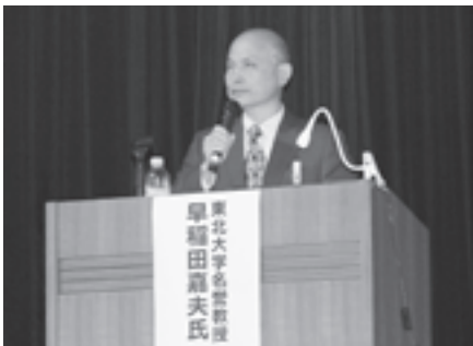
▲講演する東北大学早稲田名誉教授