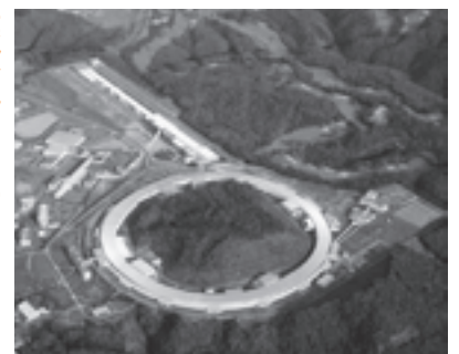
▲兵庫県に立地する放射光施設 SPring-8 (スプリングエイト)

環境にやさしい高性能三元触媒の実用化、自動車用インテリジェント触媒の実用化、髪にツヤを与えるヘアケア製品の開発、米のとき汁由来成分を配合したヘアケア製品の開発、長寿命人工関節の開発、電子製品の特定有害物質規制への対応、長寿命の次世代リチウムイオン電池の開発、ニッケル水素電池の高容量化、高性能な低燃費タイヤの開発、むし歯予防ガムの開発、等