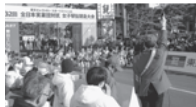
▲ 昨年の大会の様子