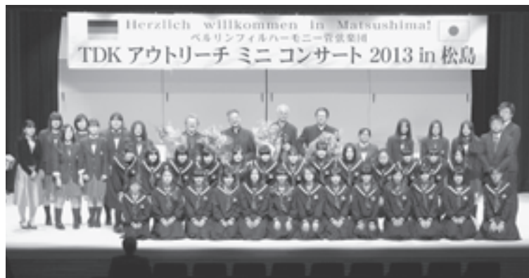
▲生徒の皆さんには、忘れられない思い出になりました