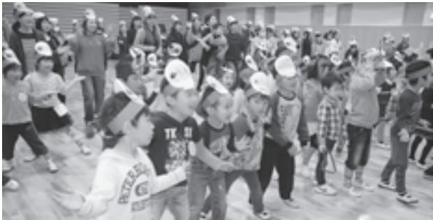
▲楽しい時間を過ごしました

11月8日、文化観光交流館で巡回小劇場が開催されました。当日は町内3つの幼稚園から子どもたちと保護者が参加。子どもたちは誕生日ごとにステージに上がり、あきらちゃん・ラーメンちゃんにお祝いの歌を歌ってもらうなど大いに盛り上がりました。