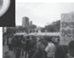
▲かき鍋を待つ長蛇の列

11月6日、7日に仙台市の勾当台公園市民広場において「仙臺鍋まつり」が開催されました。松島町から出店されたかき鍋は、順番待ちの長蛇の列ができるほど好評で、来場者の人気投票では、見事準グランプリを獲得しました。