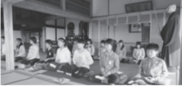
▲座禅を組む五小の皆さん

10月29日、松島第五小学校の6年生が「総合的な学習の時間」の学習で、大仰寺を訪れました。住職から大仰寺の歴史について説明を受けた後、座禅を組み、心を静めてゆったりと富山から日本三景松島を眺めました。