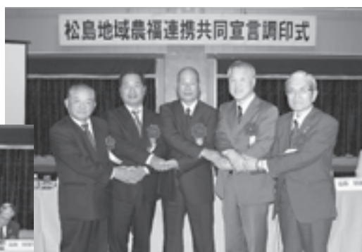
▲全国でも例を見ない試みです