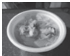
▲白だし風味のかき汁