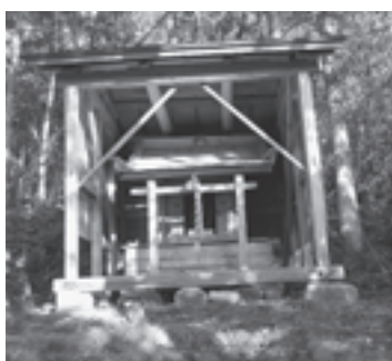
▲和合神社社殿（北小泉字堂屋45）

年明けに開催されるどんと祭では、日没近くになりますと、参道を明かりで照らすのですが、鬱そうとした雑木林の中を社殿まで歩いていくと、どこか厳かな気持ちになり、気を引き締めてこれからの1年を過ごそうという思いになります。