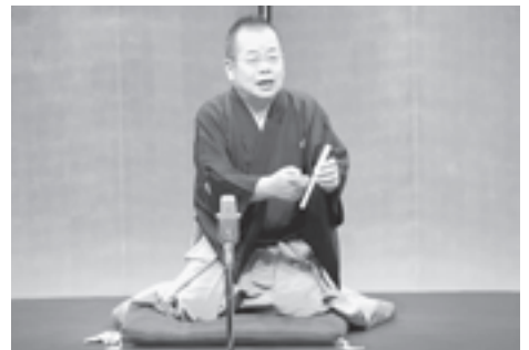
▲会場は笑いに包まれました