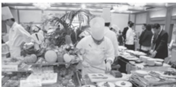
◀どれを食べるか迷うほどの種類の多さです