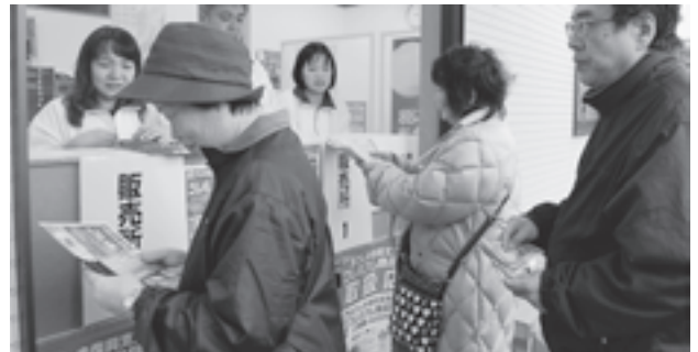
▲長い列かできました

11月10日、利府松島商会松島事務所で「松島復興支援プレミアム(2割増)商品券」が発売されました。当日は多くの町民の方が集まり、商品券を買い求める列ができました。この商品券は町内の商品券取扱店で利用できます。