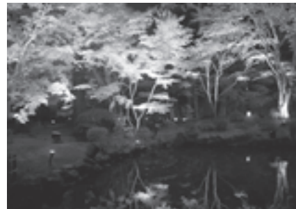
▲趣向を凝らした演出に来場者は大満足でした