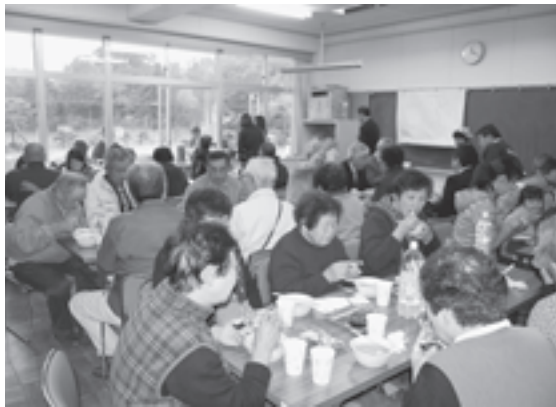
▲地元のおにぎりをおいしくいただきました

手樽地域交流センターで、恒例の手樽地区の収穫祭が行われました。当日は小雨が降るあいにくの天気でしたが、集まった手樽区民の皆さんは、おいしい芋煮と手樽産のササニシキを使ったおにぎりを食べ、会話を花を咲かせながら楽しいひと時を過ごしていました。