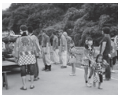
▲今年9月に開催された和合神社大祭の様子