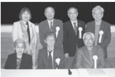
▲審査員の先生の方々