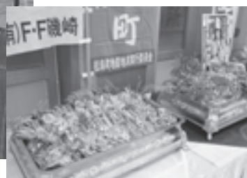
▲松島の旬の味覚が勢ぞろい