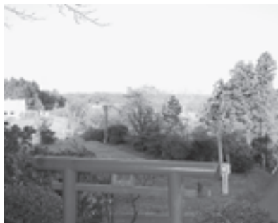
▲東部コミュニティセンター近くにある芋澤神社からの眺め

区名にある「小泉」についてですが、「肥泉」と書いて「こいずみ」と読んでいたそうです。今でも「肥泉」の地名は区内に残っていますが、周辺は土壌が豊かだったようで、肥料分を含んだ水が湧き出るという意味から名づけられたそうです。