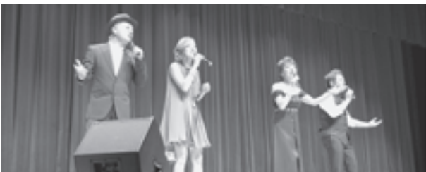
▲熱唱するサーカスの皆さん

震災復興支援の一環として、被災地を巡り美しい歌声を披露している「サーカス」の皆さん。当日集まった聴衆の皆さんも美しい「サーカス」のハーモニーを楽しんでいました。