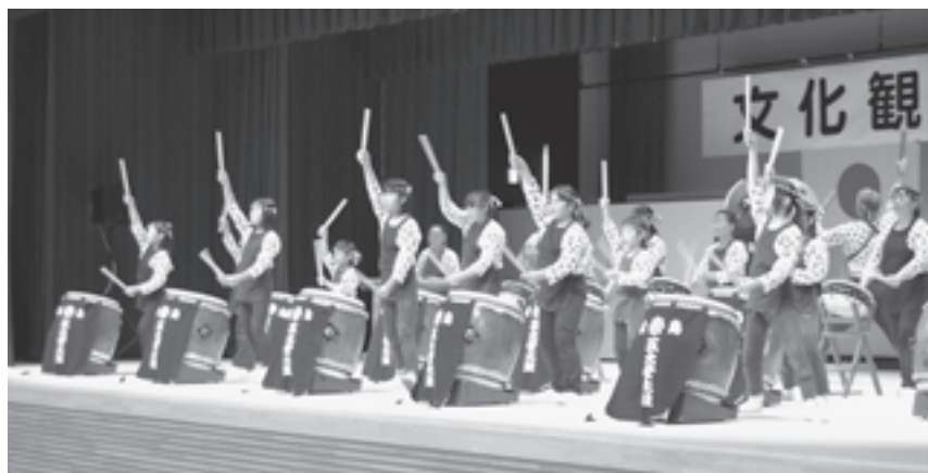
▲練習の成果を披露

同法人は、町内で農作物の生産と加工を行いブランド化を目指します。その中では、障がい者の雇用をするという全国でも初の試みとなります。