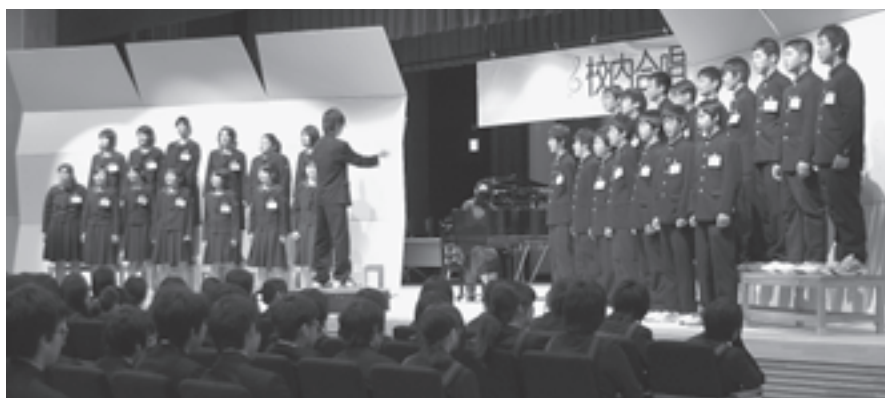
▲美しい合唱を披露しました