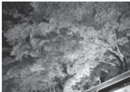
▲きれいに色づきました