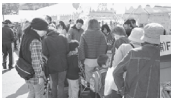
▲例年にない盛り上がりを見せた今年の産業まつり