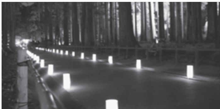
▲瑞巖寺参道もライトアップ

大会までの間、放課後などを利用して練習してきた生徒の皆さん。先生方の審査を悩ませる見事な合唱を披露していました。