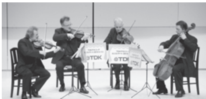
▲世界最高峰の演奏をするベルリンフィルの皆さん