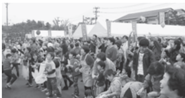
▲恒例のもちまきには大勢の方が集まりました