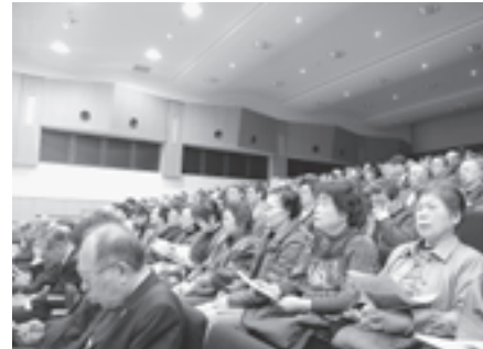
▲町民など約400人が参加

し、「放射光施設はひと言で言えば『強力な光を使った顕微鏡』。新しい産業振興の中核拠点になる。東日本大震災からの復興のシンボルにもなるので早期に実現したい」と施設を誘致する意義を述べました。 このシンポジウムは、施設を本町に誘致し経済の活性化を図り、松島町が、東北の「復興」と「ものづくり新産業の創出」を牽引する役割を果たすため、町民の皆さんに同施設に対する理解を深めていただき、町が一丸となって誘致に取り組みもうと開催されました。