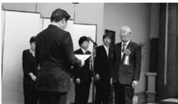
▲町の為に尽力された方々へ感謝の気持ちを込めて