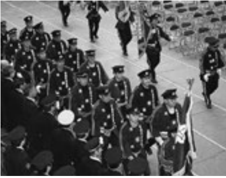
▲勇壮に行進する消防団の皆さん

お弁当の中身は、カキの炊き込みご飯に、鶏肉の「松」風焼き風、「竹」輪(ちくわ)磯辺天、れんこん「梅」肉和えなどで、おかずに「松竹梅」の名が付く縁起のいいお弁当になっています。