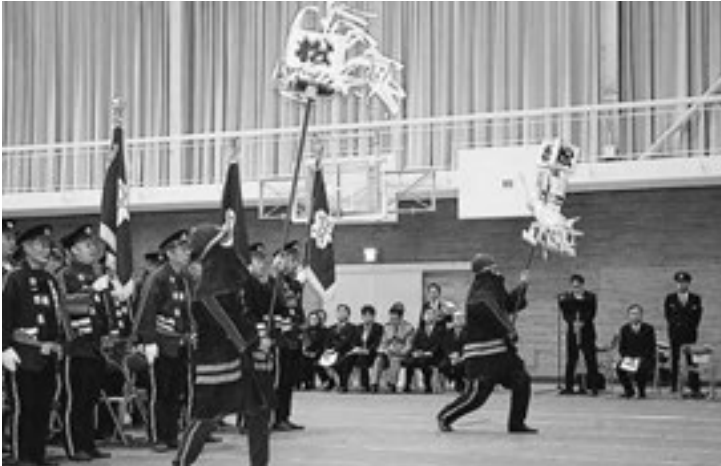
▲火消しの象徴である纏 まとい 振りが披露されました