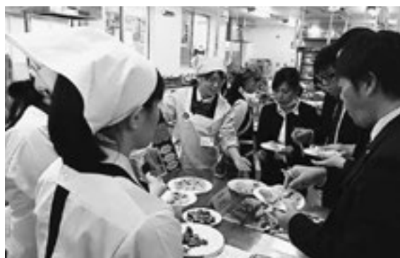
▲お弁当コンテストで大変好評でした