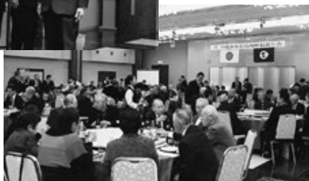
▲楽しく新年を祝いました