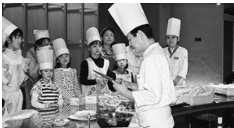
▲シェフの指導を受ける子供たち

12月20日、今年で6回目を迎えた「家族ふれあい料理教室」を開催しました。この教室は、ホテル松島一の坊の協力により、レストランで直接シェフから料理のポイントを教わります。子ども達は包丁で上手に野菜をカットしたり、ケーキ作りにチャレンジしました。