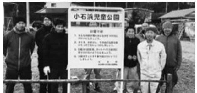
▲今年もボランティア活動を行いました

松島町職工組合青年部の皆さんがボランティア活動として小石浜児童公園の看板塗装を行いました。毎年、町内の公園看板を塗装している青年部の皆さん。今年も職人技術を生かしたボランティア活動を行いました。