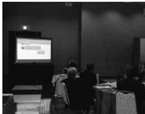
▲松島町のふるさとCMを鑑賞しました