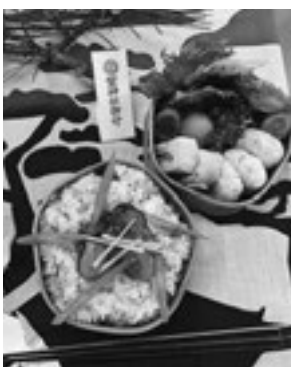
▲優秀賞を獲得した松島高校のお弁当