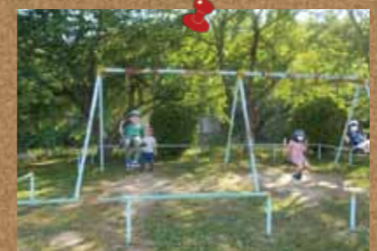
▲日常が戻りつつあります。(2小学区ひまわり学級)