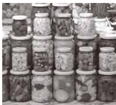
▲色とりどりのピクルス

夏は冷たい食べ物を食べたくありませんよね。加えて、今年の夏も暑くなりそうなので、アメリカの伝統的な保存食について紹介したいと思います。