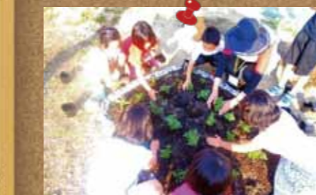
▲「松島町児童館庭園」みんなでお花を植えました！(1小学区 たんぼほ学級)