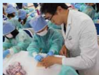
▲平成30年8月に実施した「スマセイアフタースクールプロジェクト～心臓外科医のシゴト～」の様子

えんぴつ、色えんぴつ、消しゴム、液体のり、塗り絵、カラーペンセットをご寄付頂き早速各学級で使用させて頂きました。今回、ご寄付を頂いた団体の放課後NPOアフタースクールさんとは、2年前に開催した「スマセイアフタースクールプロジェクト～心臓外科医のシゴト～」というイベントを通じて知り合いました。当時、お世話になった先生方も医療現場の最前線で大変な日々を送られていると思います。感染拡大を防ぐために、わたしたちが身近にできることを続け、気持ちを寄せ合ってこの難局を乗り越えましょう。