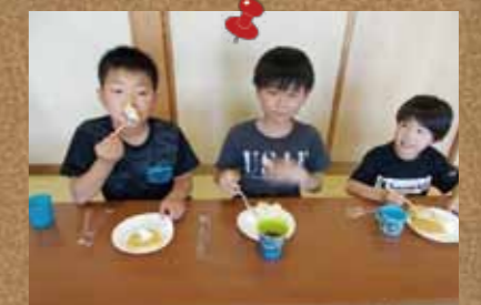
▲沢山食べて免疫力UP!(5小学区どんぐり学級)