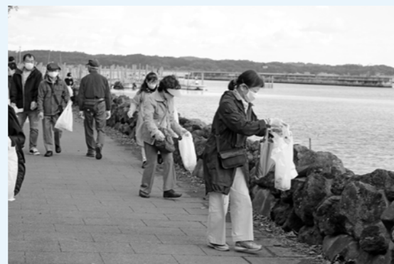
▲景色も楽しみながら清掃活動を行いました

松島湾が平成26年に日本で初めて加盟した「世界で最も美しい湾クラブ」では、各湾の魅力を活かした持続可能な発展のための取り組みや、湾の環境保全活動を行っています。11月3日、松島湾ではアマモ場再生活動と清掃ツアーの2つの事業が行われました。 福浦橋では、NPO法人環境生態工学研究所による「松島湾アマモ場再生活動」が実施されました。この活動は、震災による津波で激減した藻場を再生するため、アマモの生育に適した底質に近づけることを目的としています。福浦橋を訪れた多く