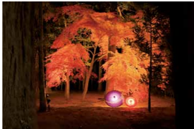
▼ライトアップされた和傘と紅葉

光と音で彩られた五大堂の他、瑞巖寺参道、洞窟群、地藏堂や三聖堂がライトアップされ、幻想的な光景に多くの人々が見入っている様子でした。また、日中には円通院の美しい紅葉を、夕方にはサンセットクルーズを楽しむ人々で賑わっていました。瑞巖寺の夜間特別参拝日には、夜間限定の御朱印も頒布され、多くの参拝客が訪れました。