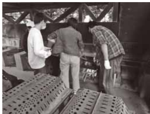
▲飯ごう内の水の沸騰具合を調べています。