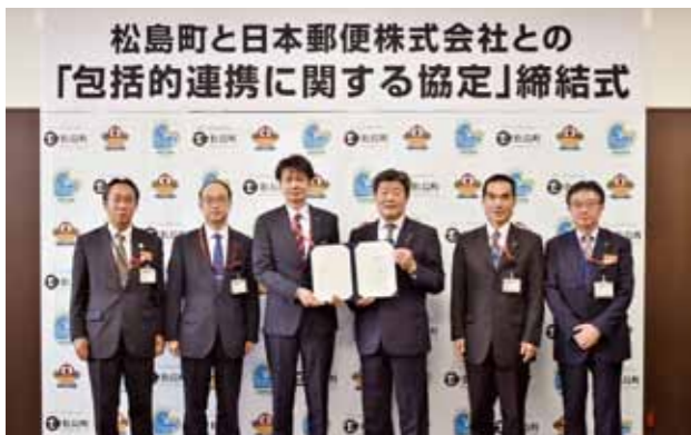
▲ きめ細やかな情報提供等が期待されます。

この協定は、郵便局のネットワークの活用を通じて、日常の防災活動や大規模災害発生時の相互協力、高齢者や子ども等の見守り、道路損傷や不法投棄等の情報提供、地域経済の活性化など、町民の安全・安心と住民サービスの向上等に資することを目的に締結されました。