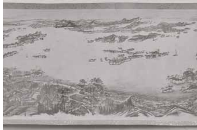
▲松島から出展予定の【松島景勝図】