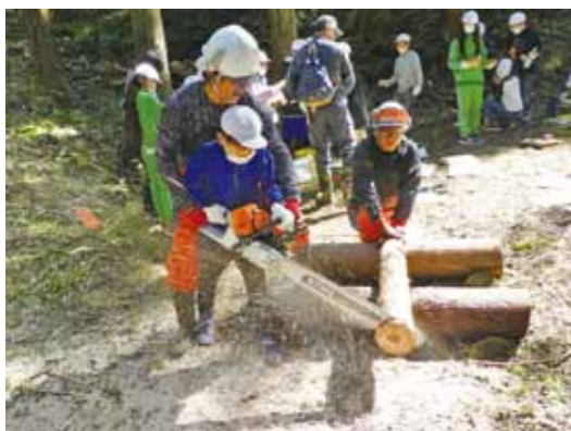
▲ サポートを受けながらのチェーンソー体験をしました。

この学習は、「松島まねごと」学として、宮城中央森林組合の方々に協力をいただき町内全小学校5年生を対象に実施しています。