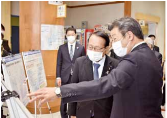
▼松島海岸レストハウスにおいて櫻井町長から説明を受ける平沢復興大臣

また同日、竣工した松島どんぐり太陽光発電所で竣工式が行われ、日本国土開発株式会社朝倉建夫社長をはじめ事業関係者らが出席し、神事を行うなどして完成を祝いました。