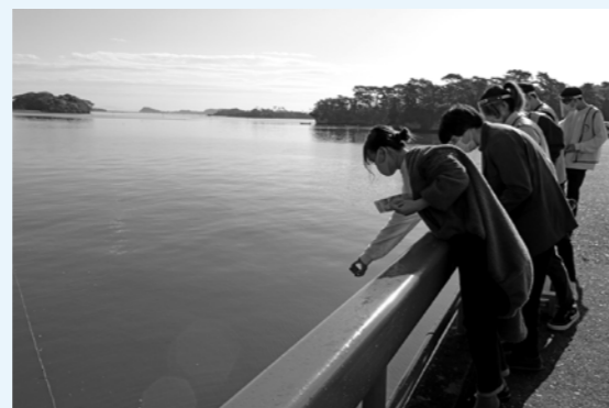
▲砂団子を投げ入れる観光客