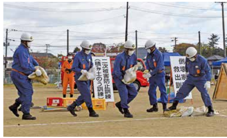
▲昨年度防災訓練の様子

町では、消防をはじめ防災関係機関・団体と連携のもと、地震や津波、土砂災害を想定した総合防災訓練を開催します。 総合防災訓練は、災害対策基本法や町の地域防災計画に基づき、大きな被害をもたらす地震発生時の応急対策を迅速かつ的確かつ総合的に実施できるような各種訓練を行うことにより、防災体制の強化を図ることを目的とします。