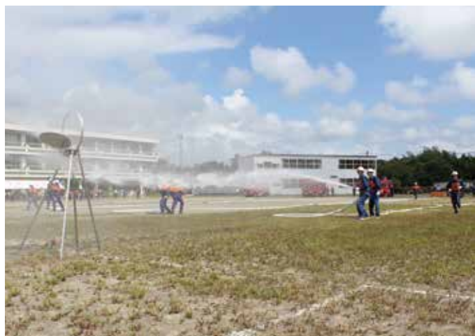
▲小型ポンプ操法の様子