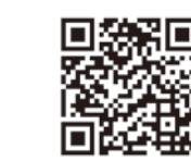
▲県ホームページはこちら

仙塩広域都市計画区域マスタープランなどの変更に関する説明会・公聴会を開催します。 ●日時 10月27日(金) 午後7時～ 11月9日(木) 午後7時～ ●場所 塩竈市民交流センター会議室2・3 説明会 宮城県庁 11階 1109会議室 ●公聴会 宮城県庁 11階 1109会議室 ※素案の内容は宮城県ホームページをご覧ください。