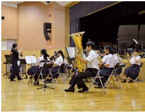
▲松島中学校吹奏楽部による演奏