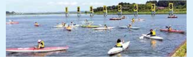
▲カヌーをまっすぐ進ませるにはパドル操作が大事ですよ

マリンスポーツの魅力を体験してもらうイベントが4年ぶりに登米市の長沼ボート場で開催され、町内の小学生が参加しました。