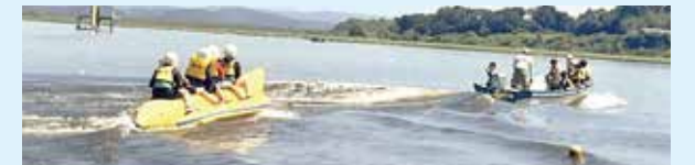
▲バナナボートに乗るためにはバランス感覚が必要ですよ