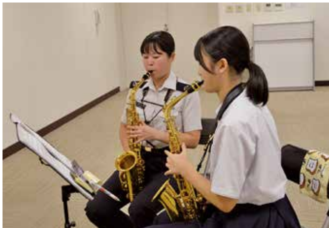
▲音楽指導を受ける様子