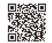
▲出合いサポート支援金はこちら

●出合いサポート支援金 「みやぎP-RSA」「みやまり」に入会された、申請日時点で39歳以下の1年以上松島町に在住の方を対象に最大1万円の支援。 ●新婚世帯応援事業支援金 婚姻日時時点で夫婦ともに39歳以下で、夫婦双方または一方が松島町内在住の方を対象に、引越費用、住宅取得費用、住宅リフォーム費用、アパート等の賃料で支払った経費に対して最大10万円を支援。