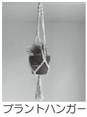
プラントハンガー