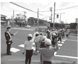
▲交通指導をする様子