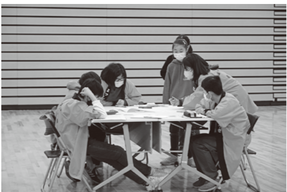
▲グループワークを行い、子供たちと活動する際の安全管理について学びました