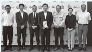
▲衛生用品を寄附いただいた企業のみなさん