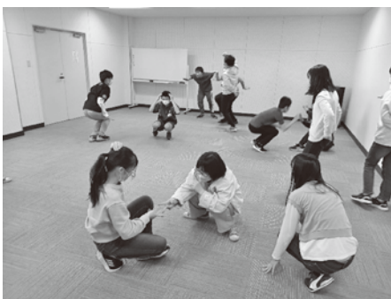
▲「進化じゃんけん」の実践中！