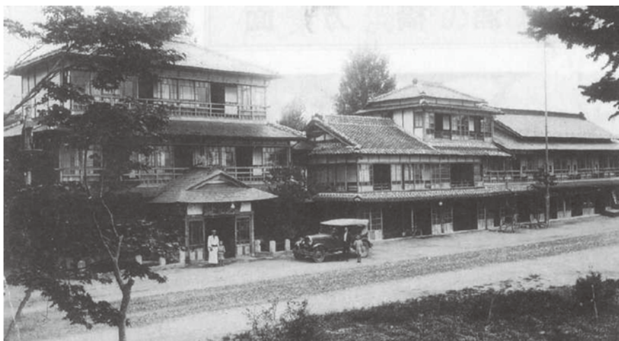
大正～昭和前半ころの東洋館の様子