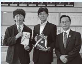
▲左から松華堂千葉代表取締役、大江校長、七十七銀行藤澤松島支店長