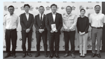
▲衛生用品を寄附いただいた企業のみなさん