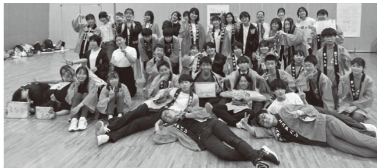
▲市町の垣根を越えて交流することができました！