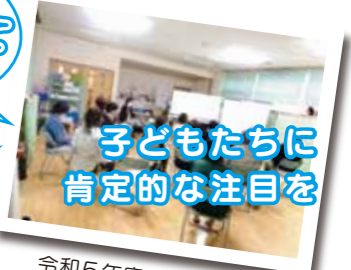
令和5年度の受講風景！