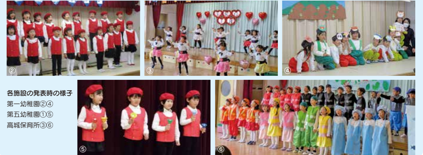
各施設の発表時の様子 第一幼稚園②④ 第五幼稚園①⑤ 高城保育所③⑥

令和5年12月2日、町内幼稚園及び高城保育所で生活発表会が行われました。高城保育所では、もも1組・2組・すみれ組は「からすのパンやさん」などの劇や「merry christmas」の合奏や歌を元気に披露しました。たんぼ組とさくら組は「めざせ！宝島」の劇や「SAXILE」や「TKG18」などの踊りを自信いっぱいに元気よく発表しました。第一・第五幼稚園では、年少組はダンス「いろにんじや・ラーメン体操」や「フレンド・ライク・ミー」を、年中組は劇「おおきなかぶ」や「北風と太陽」を、年長組は手話を入れた歌「小さな世界」やハンドベルをつかった「キラキラぼし」を元気いっぱい披露してくれました。普段の幼稚園で行っており活動を楽しく発表することが出来ました。