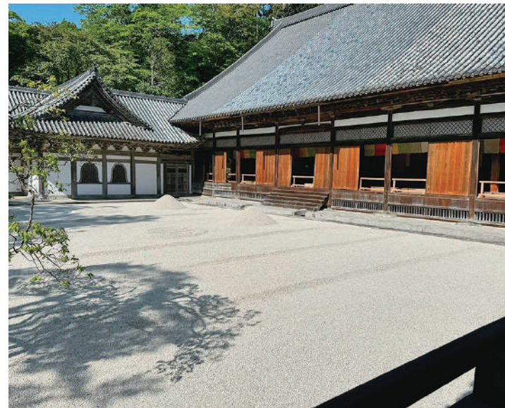
▲本堂前庭の白砂と龍のように見える臥龍梅の影

瑞巖寺では、4月30日に本堂前庭に白砂が敷かれたことで、装いを新たにしました。本堂前庭の白砂は、時期やイベントに合わせて砂紋が変わる予定です。季節や時間帯により光の入り方が変わるため、白砂に映る臥龍梅の影が龍のように見えることもあります。参拝の際には、ぜひお庭もお楽しみください。