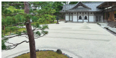
▲新しく敷かれた白砂 (2枚)

瑞巖寺では、4月30日に本堂前庭に白砂が敷かれたことで、装いを新たにしました。本堂前庭の白砂は、時期やイベントに合わせて砂紋が変わる予定です。季節や時間帯により光の入り方が変わるため、白砂に映る臥龍梅の影が龍のように見えることもあります。参拝の際には、ぜひお庭もお楽しみください。