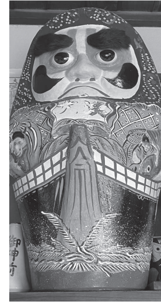
▲高城O家所蔵資料(下半分は宮城県沖地震で破損し修復)