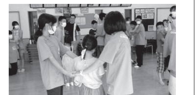
▲初原分館「お楽しみ会」子供たちとたくさん交流できました！