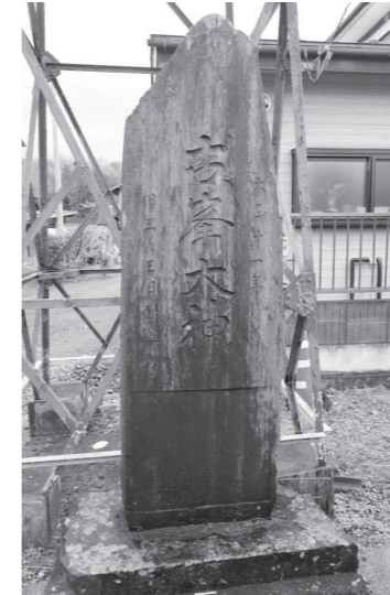
▲上竹谷片町の古峰碑

『松島町史通史編Ⅱ』には後根廻には11月と12月の13日に精進講があったことが記されています。また日吉山王神社境内（明治40年）、紫神社境内（大正9年）、上竹谷片町（大正