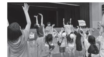
▲児童館「こどもまつり」ゲームと工作を担当しました！

中2以上のメンバーも、後輩たちをフォローしながら、時間配分やゲームの構成などを意識して1つ1つの活動に取り組むことができました。