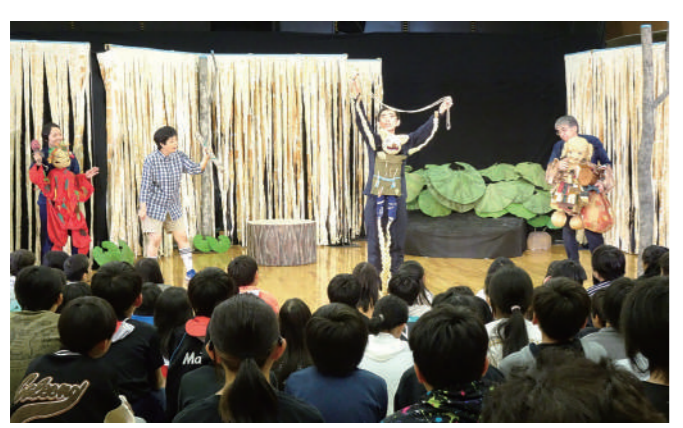
▲子どもたちは身を乗り出して見入っていました!