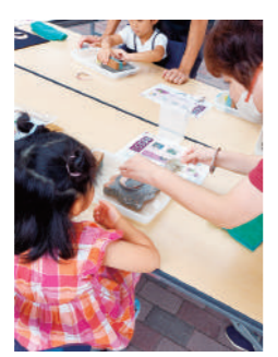
▲貝のアクセサリ (砥石で貝を磨く様子)