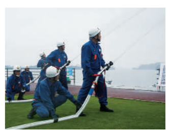
▲火災防備訓練の様子

11月2日に磯島で防災訓練が実施されました。各種被害状況を想定し松島消防署や自衛隊、塩釜警察など関係機関と連携した訓練の他、火災防備訓練を始めとした消防団による倒壊家屋等救助訓練を実施しました。また、松島町婦人防火クラブによる水バケツでの初期消火訓練や災害協定を締結している各事業者の他、防災用品を取り扱っている事業者や宮城県松島高等学校から防災関連事業の展示がありました。その他にも高城区、磯崎区、桜渡戸区による自主防災組織での避難所開設運営訓練を実施し、高城区については宮城県にて運用を開始しているマイナンバーカードを活用したデジタル身分証アプリ(ポケットサイン)での避難所受付訓練を行いました。