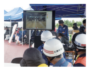
▲映像伝達訓練の様子