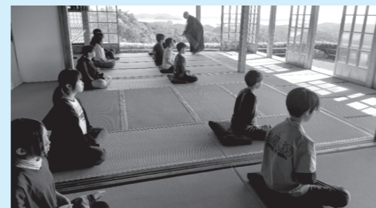
▲大仰寺での坐禅体験