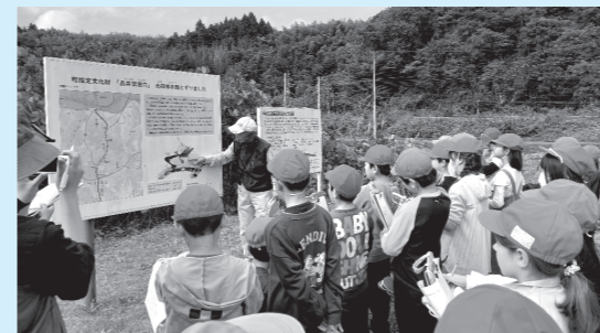
▲講師の説明をメモを取りながら聞きました!

10～11月にかけて6年生の坐禅体験、4年生の品井沼干拓学習を実施しました。(松島第一小学校は8月に実施) 坐禅体験では心構えを学んだり警策を受けたりする体験を通して、心の落ち着きの大切さを学びました。 品井沼干拓学習では、見学を通して干拓事業の大変さや今も続く水との戦いについて学びました。