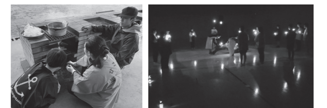
▲寒かったので、火のありがたみを実感しました… ▲班ごとにスタンツも披露しました

近隣二市三町のジュニア・リーダーサークルでは年間3回の合同事業を行っています。 例年夏休みに開催している「合同キャンプ」は近年の猛暑を鑑み9月21日・22日に開催。今年は松島が運営の主担当ということで、日常の研修もこのキャンプを目標に実施してきました。当日はあいにくの雨に加え気温も低く、計画通りの活動が難しい場面も多々ありましたが、活動変更にも柔軟に対応できていました。野外炊飯や空き缶ランタン作り、キャンドルセレモニーなどの活動を通じ、参加者同士楽しい時間を過ごすことができました。 今後も近隣サークルのジュニア・リーダーたちと交流しながら、スキルアップを目指して活動していきます。