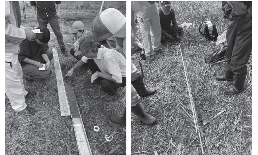
▲ジオスライサーで採取した資料の検討状況 ▲ボーリング調査の結果検討状況

事前に地中レーダー探査を行い、調査ポイントを決定したあと、人力で作業を行いました。詳細な分析はこれからですが、福浦島の調査地点では2011年3月11日の東日本大震災の際に堆積した津波の痕跡かと思われる土も確認できました。