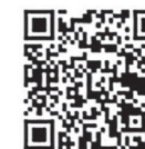
国税庁HP (定額減税特設サイト)