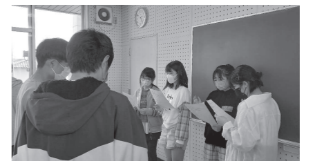
◀共通点ビンゴのようす