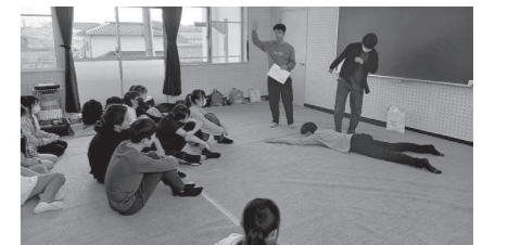
▶高校生会員によるゲーム研修