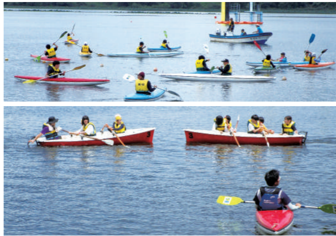
(会場は登米市迫・長沼ポート場)