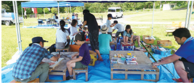
▲木工体験や簡易プールでの水遊びでもいっしょに遊びました！