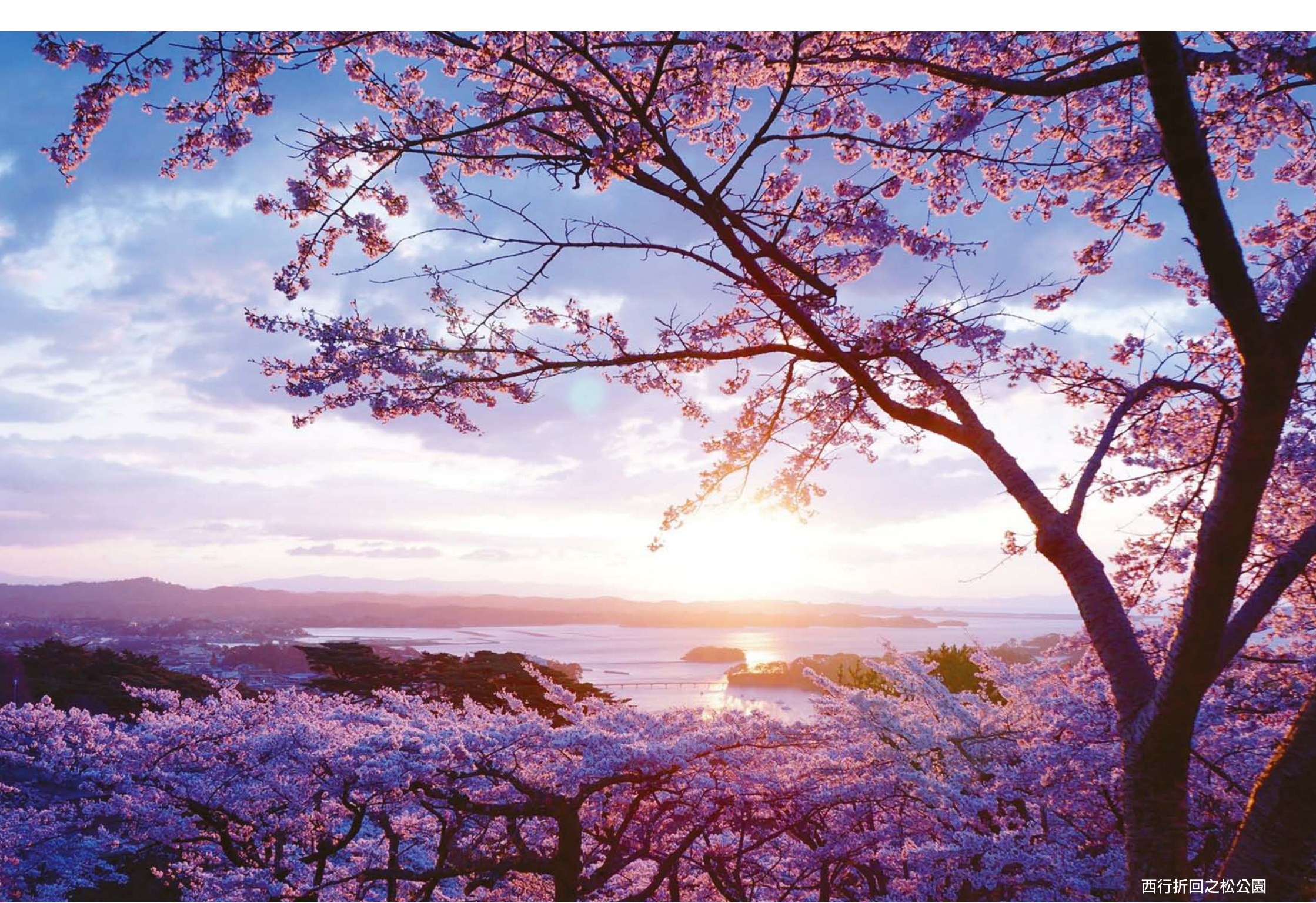
西行折回之松公園