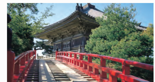
五大堂へ渡る透かし橋からは5m下の海面がのぞける

五大堂への一本目の橋を渡ったところにある「松島八幡」という小さなお堂は、疫病などの悪疫退散のために建てられたと伝えられています。